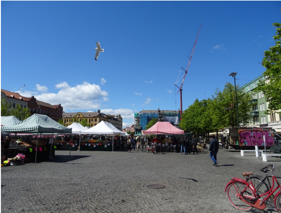
Figur 5. Møllevångstorget torsdagen 14 maj 2020, klockan: 12.59.