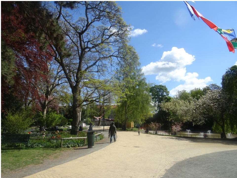
Figur 3. Folkets park måndagen 4 maj 2020, klockan: 11.50.

I folkets park, vid lekplatsen /.../ När jag är där med barnen känner jag mig trygg. Det är mycket människor och barnanpassade grejer /.../ Hela Folkets park är ju barnanpassat. Barnen är glada där och då har jag det bra. (Beatrice, 27)