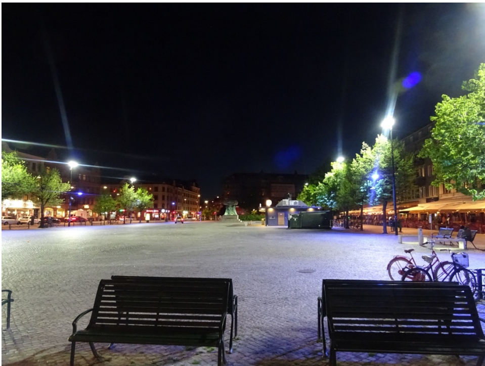
Figur 6. Möllevångstorget tisdagen 12 maj 2020, klockan 22.44.

Aspekten av sociala relationer i stadsmiljön refererar därför inte bara till sociala maktsituationer där kvinnor känner sig underminerade, sårbara och rädda för män, utan handlar även om de sociala mötena som dagligen sker i stadsmiljön mellan människor/grupper som faktiskt främjar kvinnors upplevelse av trygghet. Sociala relationer i stadsmiljön är på så vis en viktig förutsättning för kvinnors upplevelse av trygghet så länge det inte handlar om sociala möten som präglas av maktrelationer där kvinnor känner sig underminerade och hotade.