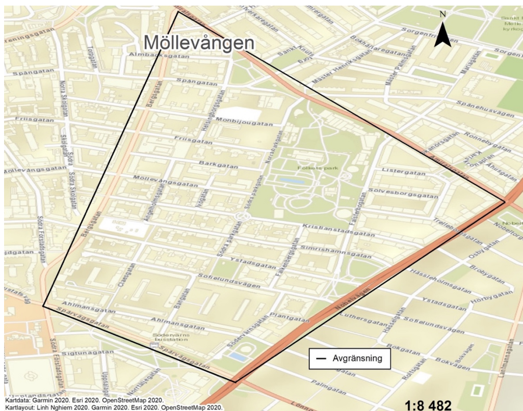
Figur 1. Karta som illustrerar den geografiska avgränsning som gäller för studiens kartläggning.

Undersökningspopulationen avgränsas i denna studie till individer som identifierar sig som kvinnor och bor eller vistas på Möllan ofta. Ingen åldersavgränsning gjordes vid datainsamlingen, däremot visade det sig att studiens enkätundersökning främst kom till att besvaras av unga kvinnor mellan 18 och 34 år.