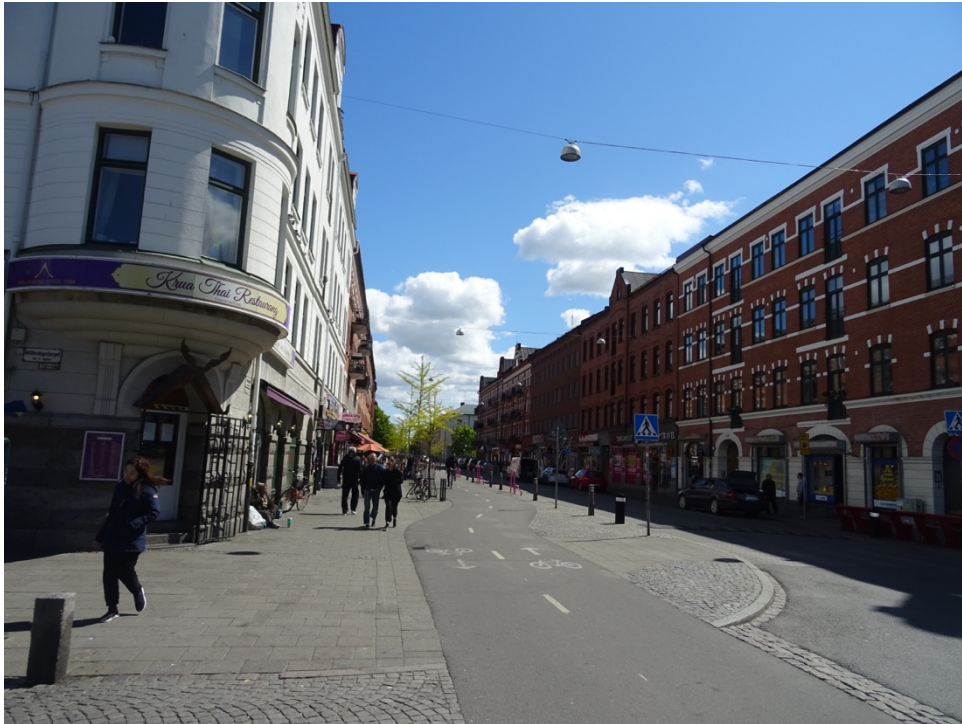
Figur 8. Ystadgatan torsdagen 14 maj 2020, klockan: 11.45.