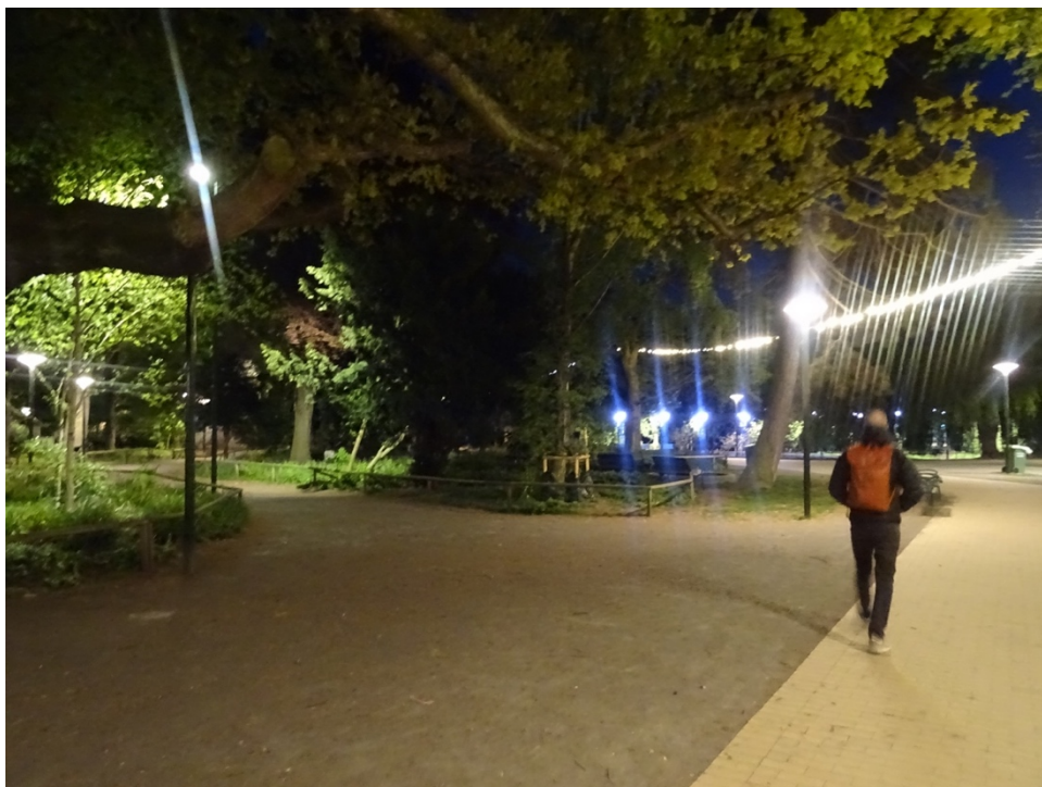
Figur 4. Folkets park tisdagen 12 maj 2020, klockan: 22.17.

de endast i kombination med aspekter av föreställningar och levda erfarenheter skapar rädsla för att blir utsatt för våld- och sexualbrott (Listerborn 2002: 97).