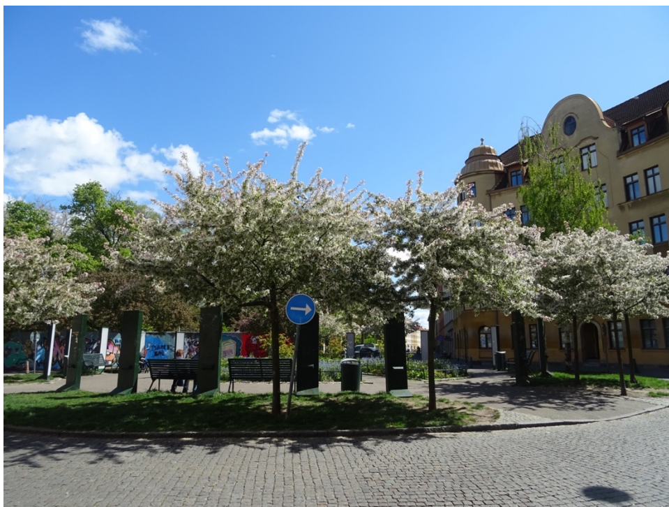
Figur 7. Bild på Rondellen torsdagen 14 maj 2020, klockan: 12.22.