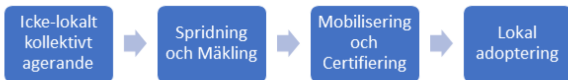
Figur 2. The Domestic Impact of Transnational Activism. Källa: Tarrow 2006:187 (figur översatt från engelska till svenska)

Tarrows teori visualiseras i figur 2. För att det icke-lokala kollektiva agerandet ska påverka aktiviteten inom enskilda stater, krävs det först att informationen (aktivitetsformerna) sprids . (Tarrow 2006:185-190). 'Informationen' kommer i denna studie framförallt att syfta på informationen kring abort och reproduktiva rättigheter. Då det handlar om informationens 'spridning' kommer därmed rörelsernas agerande att analyseras då de arbetar med att sprida informationen samt vad som bestämmer huruvida informationen sprids till en stat eller inte.