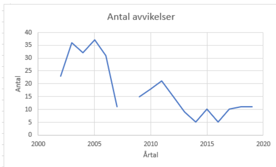
Figur 1: Visar antalet avvikelser för respektive år.

En tydlig tendens är att antalet avvikelser minskat avsevärt över tid även om det för de senaste åren finns en antydning till ökning.