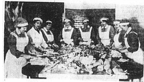
Lottorna stycka skinkor till julkorven.

Känsloklimatet som råder under julmånaden är blandad. Samtidigt som människor oroar sig över attacker, försöker de ändå finna frid och fira jul som vanligt i den mån det går. En årssammankomst för skidfrämjande hölls och Lottakåren förberedde sig för julmässan, vilket var viktigt för deras kassa. Andra tillställningar var en kaninutställning dit stora delar av