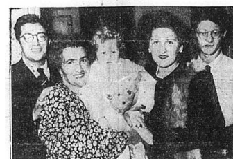
Flyktingströmmen från Danmark till Sverige fortsätter alltjämt. Bilden visar en judfamilj i förläggningen på Borgarskolan i Malmö.