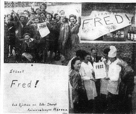
Landskrona mottar budskapet om freden. Överst t. v.: De ungerska flyktingarna mottaga fredsbudskapet med glädje och V-tecken. Nedre t. v.: Den första "fredsförklaringen" i Landskrona, freden i en frikarnalag. Överst t. h.: Orkan en fredsförklaring. Nedre t. h.: Representanter för skilda kyrkor samlas för att studera L. P. extra upplaga.

När flaggorna i Landskrona gick i topp på lördagsmorgonen skedde det under klangen från Köpenhamns alla kyrkklockor, som ringde in Danmarks frihet – klockornas klang nådde oss genom radion. Vi anade här hur stämningen måste vara i broderstaden på andra sidan Sundet – den var hög i Landskrona. Alla människor gick omkring med ett leende på läpparna och alla danskar, kända och okända, hälsades med lyckönskningar. 123