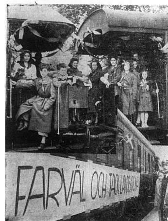
Särskilda "flyktungjärer" avsåg en dagligen från Halmstad och Malmö. De skånska städerna ta farväl av sina danska gäster. Bilderna visa danskarnas avfärd från Landskrona. Se art. sidan 2.