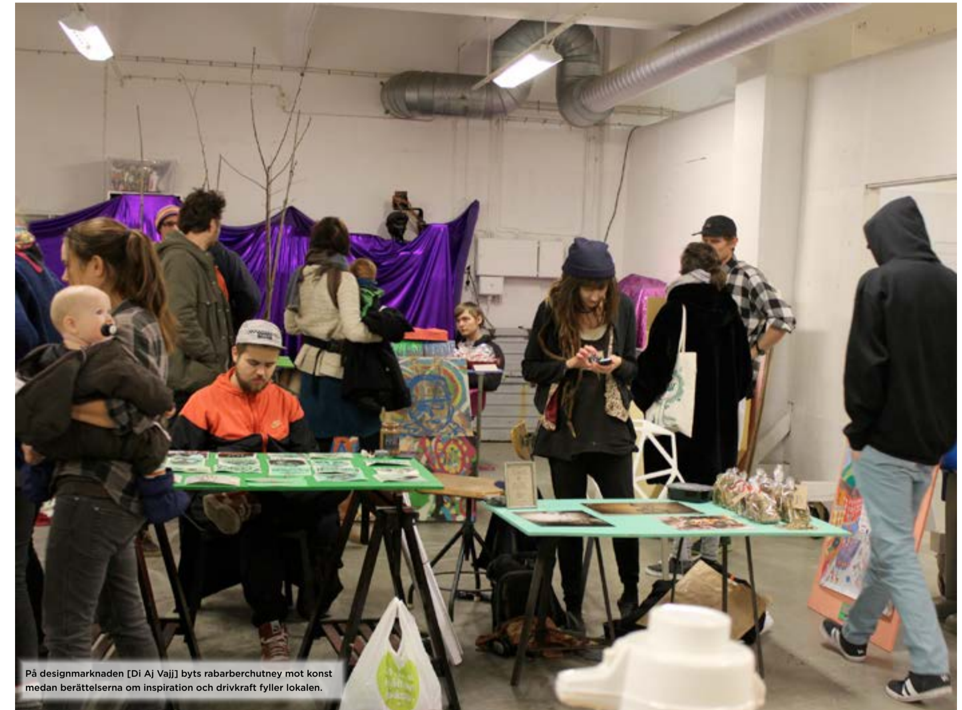
På designmarknaden [Di Aj Vajj] byts rabarberchutney mot konst medan berättelserna om inspiration och drivkraft fyller lokalen.

Många som är mot allt det här superkapitalistiska vill ändå köpa presenter till vänner och familj, då känns det riktigt skönt att kunna erbjuda ett alternativ.