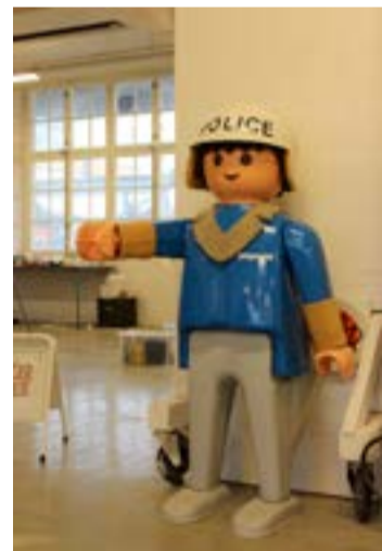
I Huset hittar du både cykelverkstad, hamburgerkuddar och en gigantisk legopolis.

[Di Aj Vajj] designmarknad arrangeras en gång i månaden på Södra Bulltoftavägen på Kirseberg i Malmö. Om du vill byta/sälja dina saker eller komma förbi och titta kan du maila SmutsigaSodern@gmail.com eller gå in på facebooksidan http://www.facebook.com/smut-siga.sodern