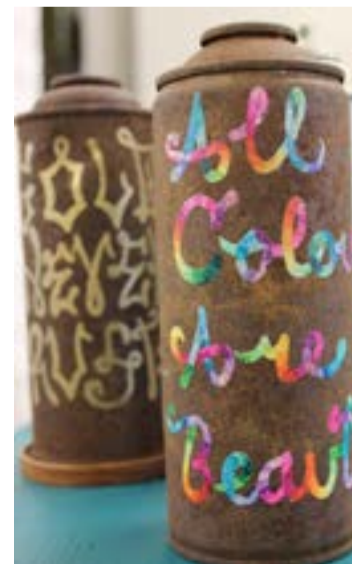
på rostiga burkar har markus skrivit "alla färger är vackra" och "guld rostar aldrig".