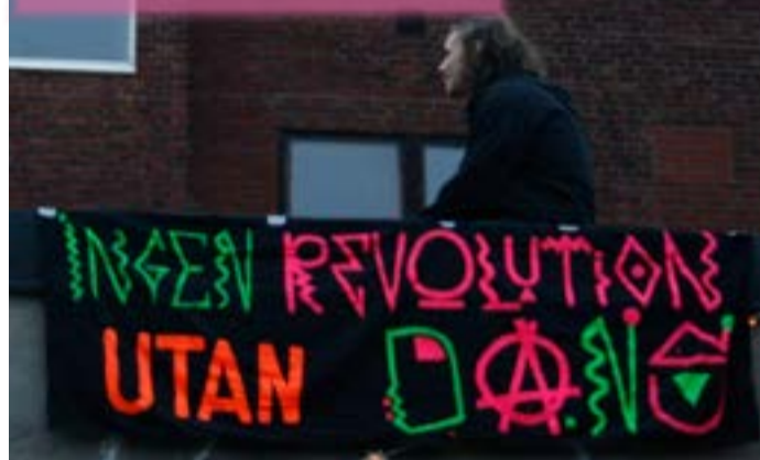
Flera gratisfester har utspelat sig på Malmös gator och torg.