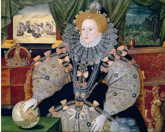
Bild 5. Konstnär okänd, Armada Portrait , 1588, olja på duk, Woburn Abbey.