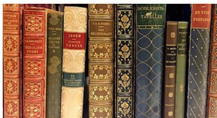
Bokryggar med handförgyllning med stämplor av olika slag. Hedbergs bokbinderi.

I KB finns en samling förgyllningsstämplar för bokbandsproduktion. Stämplarna förvärvades i mitten av 1900-talet från flera stora bokbinderier: Bernhard Andersson, Esselte Herzog, Hedberg och Stadtlander. KB:s stämpelsamling är en av världens största. Handstämplarna uppgår till ungefär 12 500 stycken. Huvudparten av samlingen är från 1600–1900-talet, men vissa av stämplarna kan dateras till 1400–1500-talet enligt köpehandlingarna. Bokbinderierna och stämplarna är representerade i KB:s och andra biblioteks samlingar.