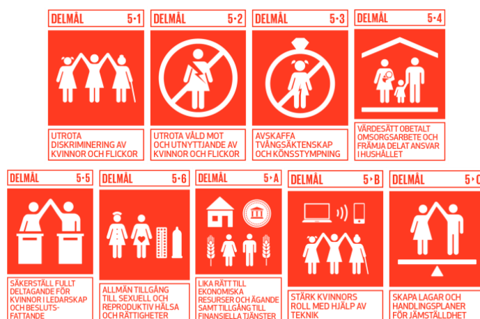
Figur 3: Jämställdhetsmålet 9 delmål (UNDP Sverige 2015)