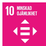
Figur 8: Globala målen mål 10 (UNDP Sverige 2015)

Deltagare C talar om att kvinnor finns i alla kulturer, samhällsklasser och befolkningsgrupper. I dessa grupper menar deltagare D att kvinnor är de mest utsatta och genom jämställdhet kan på så vis även ojämlikheter i samhället minska eftersom jämställdhet leder till minskade löneskillnader, klasskillnader och skapar mer jämlika grupper. Deltagare B och C beskriver att om kvinnor får en stärkt position kommer de även gynna andra minoriteter och utsatta grupper. Detta eftersom att människor som utsätts för orättvisor i större utsträckning blir engagerade i kampen mot sin egen men också andra människors utsatthet.