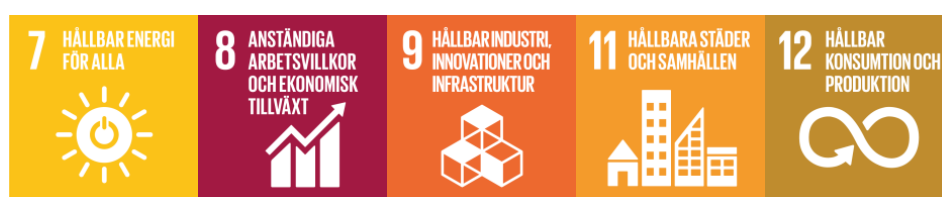
Figur 5: Globala målen mål 7, 8, 9, 11 och 12 (UNDP Sverige 2015)

Deltagarna är eniga om att kvinnor tar mer holistiska, långsiktiga och hållbara beslut - men lyfter det på olika sätt. Exempelvis beskriver de att kvinnor i ledande positioner driver hållbarhetsfrågor i organisationer och näringslivet både genom hållbarhetsredovisningar men också genom att styra hållbarhetsarbetet. Här kan vi se en koppling mellan att jämställdhetsmålet uppfylls och kvinnors egenmakt och beslutsfattande kan ha positiva effekter för Mål 7: Hållbar energi till alla , Mål 8: Anständiga arbetsvillkor och ekonomisk tillväxt , Mål 9: Hållbar industri, innovationer och infrastruktur , Mål 11: Hållbara städer och samhällen och Mål 12: Hållbar konsumtion och produktion .