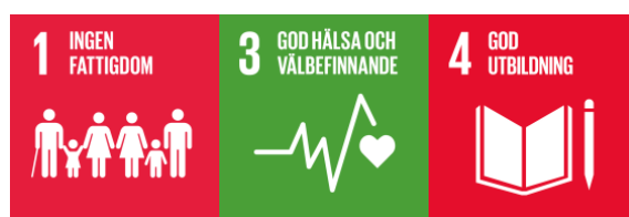
Figur 4: Globala målen mål 1, 3 och 4 (UNDP Sverige 2015)

Kvinnor och barn är, som deltagare A och D visat på, de största grupperna som lever i extrem fattigdom. Fattigdomsbegreppet i Mål 1: Fattigdom är multidimensionellt och berör det ekonomiska men även brist på frihet, inflytande, hälsa, utbildning och säkerhet. I en värld där Mål 5: Jämställdhet är uppnått har flickor och kvinnor frihet, inflytande, tillgång till sjukvård och hälsa samt utbildning och säkerhet. Alltså har Mål 5: Jämställdhet positiva effekter inom Mål 1: Ingen fattigdom , samt Mål 3: God hälsa och välbefinnande och Mål 4: God utbildning .