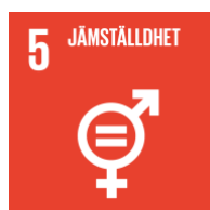
Figur 2: Globala målen mål 5 (UNDP Sverige 2015)

I jämställdhetsmålet beskrivs inte vad Agenda 2030 och FN avser med just begreppet egenmakt. I Nationalencyklopedin (u.åa) definieras egenmakt som “möjlighet för individen att (i större utsträckning) själv ta ansvar för sitt liv och sin situation”. I relation till Mål 5: Jämställdhet kan vi därför förstå egenmakt som kvinnors och flickors möjlighet att påverka sin livssituation. Hur det ska uppnås kan utöver målbeskrivningen ses i målets delmål: