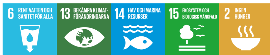
Figur 6: Globala målen mål 6, 13, 14, 15 och 2 (UNDP Sverige 2015)

Det deltagarna nämner om att kvinnor tar mer hållbara beslut syns även i hur kvinnor tar hand om ekosystem på mer hållbara sätt och påverkar miljön mindre än vad män gör. Här kan vi koppla ett uppfyllt jämställdhetsmål och flickor och kvinnors egenmakt till goda effekter på Mål 6: Rent vatten och sanitet , Mål 13: Bekämpa klimatförändringarna , Mål 14: Hav och marina resurser samt Mål 15: Ekosystem och biologisk mångfald . Även Mål 2: Ingen hunger ingår här då flera av delmålen fokuserar på framtagning av säker och näringsrik mat genom en hållbar livsmedelsproduktion.