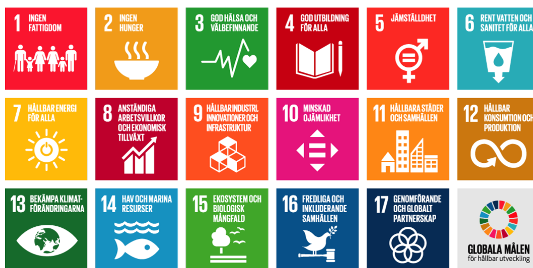
Figur 1: De 17 Globala målen för hållbar utveckling (UNDP Sverige 2015)