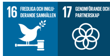
Figur 7: Globala målen mål 16 och 17 (UNDP Sverige 2015)

Deltagare A och E menar även på att om unga kvinnor får vara med i beslutsfattande kring fredsprocesser blir de mer hållbara och långvariga, vilket vi kan koppla till att jämställdhet samt flickor och kvinnors egenmakt är väsentligt för att uppnå Mål 16: Fredliga och inkluderande samhällen samt Mål 17: Genomförande och globalt partnerskap .