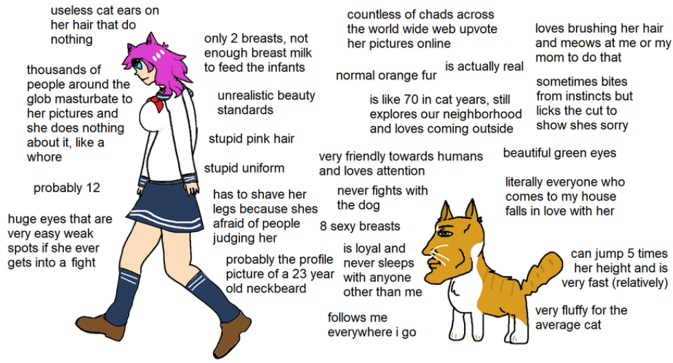
Figur 5: The virgin anime cat girl vs. The Chad my actual cat (Reddit 2020)

Virgin är klädd i en sjömansklänning med knästrumpor samt har bröst, lila hår och kattöron. Hon 5 ser annorlunda ut men behåller samma proportioner och samma ihopsjunkna hållning som i originalet. Kommentarer som omger virgin anime cat girl verkar å ena sidan syfta på nackdelarna med att vara kvinna ur ett samhällsperspektiv – hon förhåller sig till “orealistiska skönhetsideal” och måste raka benen för att inte bli dömd av sin omgivning. Å andra sidan syftar kommentarerna på virgin anime cat girls kroppsliga funktioner – hon har enbart två bröst, kattöron på huvudet som inte fyller någon funktion samt stora ögon som gör henne sårbar i strid. De fysiska funktioner som beskrivs här tycks ömsom syfta på den fiktiva anime-karakteren, och ömsom en kvinnligt kodad kropp i allmänhet.