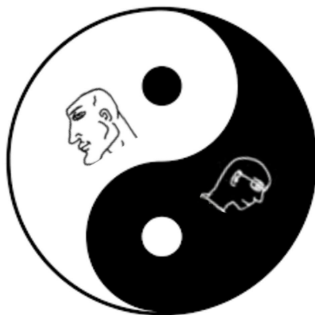
Figur 4: Without one the other would cease to exist (Reddit 2021)

Många av iterationerna av Virgin vs. Chad handlar om hur virgin och Chad är sammanlänkade på olika sätt. I memen Without one the other would cease to exist har den poängen dragits till sin spets.