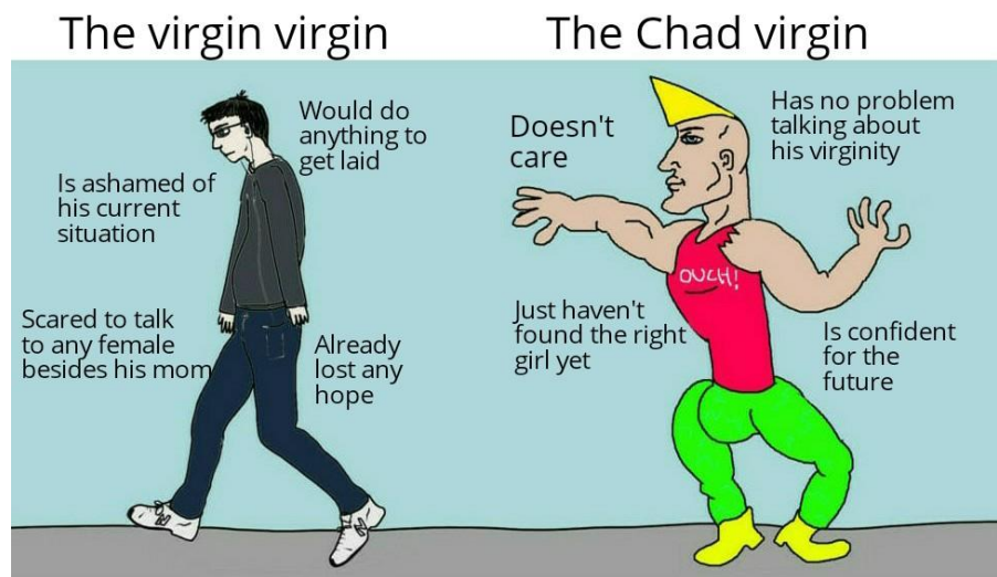
Figur 2: The virgin virgin vs. The Chad virgin (Reddit 2020)

I det första exemplet ser vi de två omisskännliga figurerna virgin och Chad, visuellt identiska med originalmemen. Premissen för skämtet i The virgin virgin vs. The Chad virgin är att de två figurerna representerar en “virgin” respektive en “Chad”-version av en oskuld (virgin i det här fallet kan ju både betyda både oskuld och karaktären “virgin”. Jag väljer att använda ordet oskuld för att förtydliga kategoriseringen från karaktären).