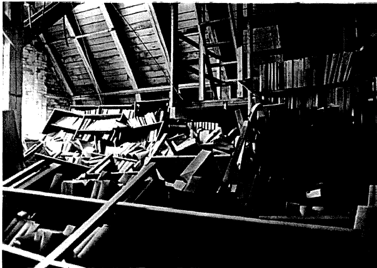
Delar av den rasade samlingen i juli 1996.

Hösten 1995 rasade ett stort antal hyllor med okatalogiserat tryck omkull på Lunds universitetsbiblioteks (LUB) vind. Var skulle man göra av allt det material som inte längre kunde förvaras på vinden? Vilka delar av den stora samlingen kunde komma i fråga när det gällde placering i depå? Vilka delar av samlingen används egentligen mest idag? Vem använder den, och till vad?