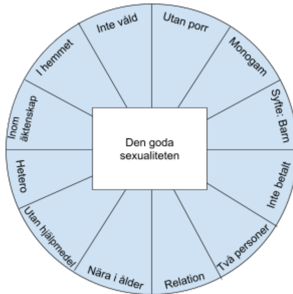
Figur 2, inspirerad av Rubin.

Denna uppställning har till syfte att visa på hur sexualiteten som sådan inte behöver bära en roll som stigmatiserad eller smutsig, utan kan tvärtom ibland vara sund och god. Förklaringsmodellen har även till syfte att visa hur vad som är “gott” och “ont” har möjlighet att förändras. Genom att de väggar som skiljer det goda från det förhandlingsbara kan den goda eller den onda sexualiteten utvidgas eller begränsas. Idag har fenomen och gärningar som tidigare befunnit sig i nära gränsen mellan den goda sexualiteten och det förhandlingsbara området passerat över till att ses som en del av en sund sexualitet. Att avgöra exakt var gränsen går för om utövandet av en sexualitet ska ses som normativt god eller ond är svårt att på förhand uttala sig om, då olika aspekter kan tänkas anses olika accepterade än andra. Det kan exempelvis tänkas att en heterosexuell person med flera tillfälliga partners ändå anses ha en “sundare” sexualitet än en homosexuell person som ingår i en långvarig kärleksrelation. 168