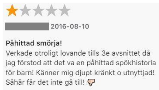
Figur: 17. Kommentar av René.

Det finns lyssnare som ställer sig starkt kritiska mot att P3 Serie är fiktion. Det mest utmärkande för den här gruppen lyssnare är sättet som de uttrycker sina känslor på efter att ha insett att P3 Serie är fiktion.