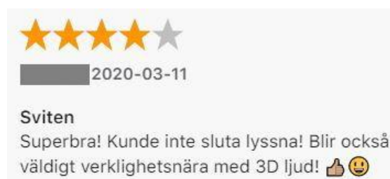
Figur: 10. Kommentar av Billie.

Det ljud som P3 Serie förmedlar kan framkalla intimitet och positiva känslor när programmet skapar en medierad upplevelse som känns verklighetstrogen. Programmet “Sviten” (2019) använder en “binaural ljudteknik” som enligt Sveriges Radio “ger bäst lyssning i hörlurar” (Sveriges Radio 2018). Den binaurala tekniken skapar en rumslig ljudeffekt, som ger lyssnaren en känsla av att befinna sig i samma rum som karaktärerna. Simulationen av “rummet” skapas via ljud som spelas in i olika ljudstyrkor, vilket lurar hjärnan att tro att ljuden kommer från olika håll och distans (ibid.). En stor del av handlingen i “Sviten” utspelar sig i ett förhörssrum. Detta gör att när till exempel, någon av karaktärerna går in i förhörssrummet hör lyssnaren hur fotsteg kommer från exempelvis, höger hörlur. Det binaurala ljudet skapar en förståelse för hur rummet “ser ut” och det känns som om man som lyssnare befinner sig i samma rum som karaktärerna i serien. Lyssnare får leva sig in i den konstruerade fiktiva världen och i det skapas ett intimt engagemang. Även den binaurala tekniken går i enlighet med den verklighetseffekt som Gibbons et al. (2019) menar kan få en publik att uppleva att den fiktiva värld som presenteras blir den verkliga världen.