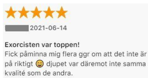
Figur: 7. Kommentar av Kim.

Den mockumentala upplevelsen av en ontologisk otydlighet som Kim fick av “Exorcismen i Eksjö” och Dara fick av en P3 Series produktioner är tillfällig eftersom de efter ett tag inser att det inte är en verklig berättelse. Visserligen, i Daras kommentar skriver hen “[...] detta kan