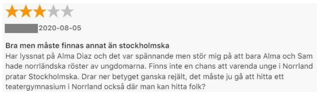
Figur: 5. Kommentar av Max.

Ett exempel när en lyssnare inte får bakgrundsinformation om karaktärerna och när verklighetseffekten uteblir visas i kommentaren nedan av lyssnaren Max.