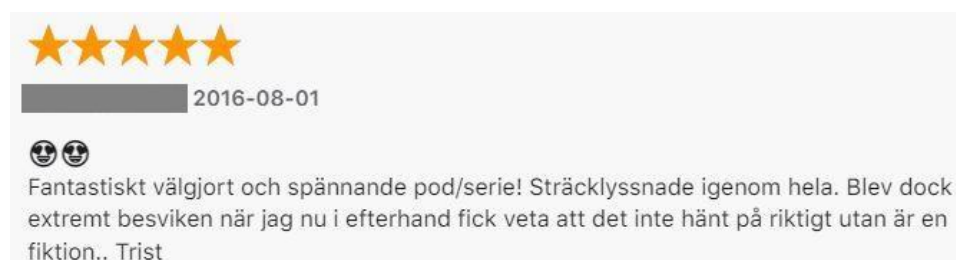
Figur: 14. Kommentar av Love.

dokumentärt format på sina produktioner innehåller de även dramatik, spänning och melodramatiska skildringar. Berättelseformen består av att någonting har hänt och genom avsnitten avslöjas det av vem eller varför detta hände. Kommentaren av Love representerar lyssnare som fick en imaginär intimitet med det presenterade narrativet i P3 Serie men som resulterade i ett brutet socialt kontrakt. Ännu en gång ger ett brutet socialt kontrakt inte några större konsekvenser eftersom Love ger ut högsta betyg, gör två hjärtögon-emojis och menar att “De dödas röster” är ett fantastiskt välgjord och spännande program.