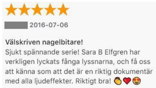
Figur: 8. Kommentar av Lo.