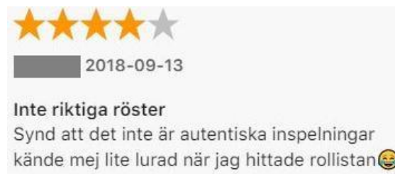
Figur: 11. Kommentar av Elliot.

Enligt Conte (2019, 23) befinner vi oss nu i en tid av mockumentaritet där gränsen mellan en artificiell verklighet och den riktiga verkligheten suddas ut till stor del med hjälp av den nya tekniken. I enlighet med detta går det att se i Billies kommentar spår av mockumentaritet när den verklighet som hen upplevde var en artificiell verklighet vilken skapats med hjälp av teknik (den binaurala).