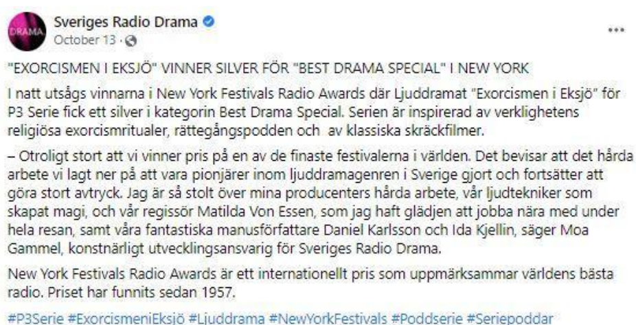
Figur: 1. Skärmlapp från Sveriges Radio Drama, Facebook 13 oktober 2021.

På Facebook skriver Sveriges Radio Drama att programmet “Exorcismen i Eksjö” (2020) är “ inspirerad av verklighetens religiösa exorcismritualer, rättegångspodden 4 och av klassiska skräckfilmer” (min kursivering och fotnot).