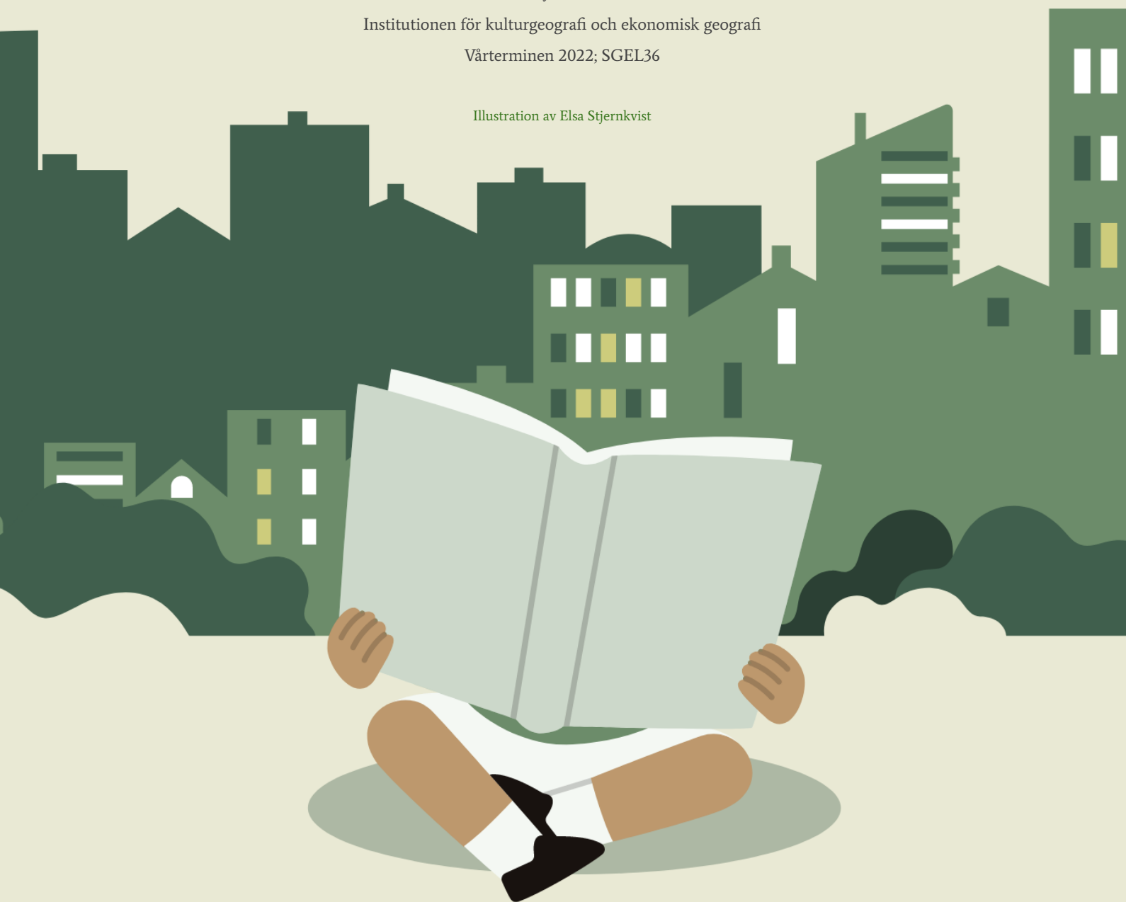
Illustration av Elsa Stjernkvist