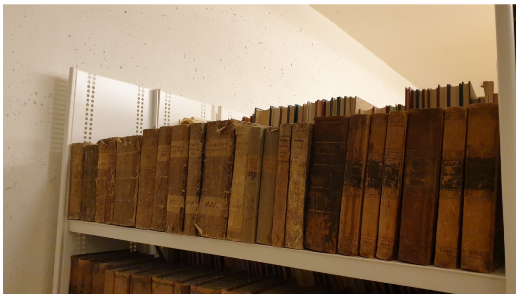
Figur 3. Svensk författningssamling på hylla. Fotografi taget av en av informanterna, februari 2022

Hälften av arkiven som använder sig av arkivboxar har också böcker stående eller liggande löst på hyllor (Informanterna E, M och N). Detta har också de sex resterande arkiven (Informanterna C, D, F, H, K och L).