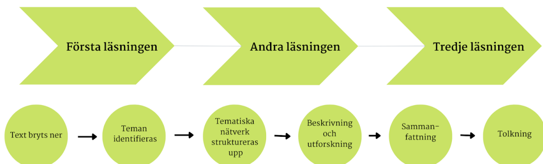
Figur 3: Hur materialet bearbetas utifrån tre läsningar i sex steg

För att bearbeta materialet på ett systematiskt och strukturerat sätt följer jag Attride-Stirlings (2001) tematiska analysverktyg, i en något modifierad version (se figur 3). Efter att ha transkriberat intervjuerna analyseras såväl intervjumaterialet som kongressbesluten och klimatrapporterna genom att separera yttranden i texten som sedan samlas i olika teman (Robertson 2018, s. 230). Mer konkret bearbetas materialet i tre läsningar bestående av sex steg.