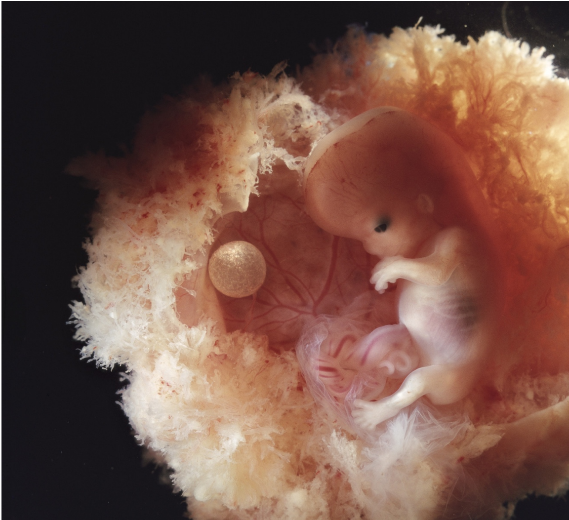
Bild 1: Foster, 12–13 veckor. "Ett barn blir till", 1990. 43