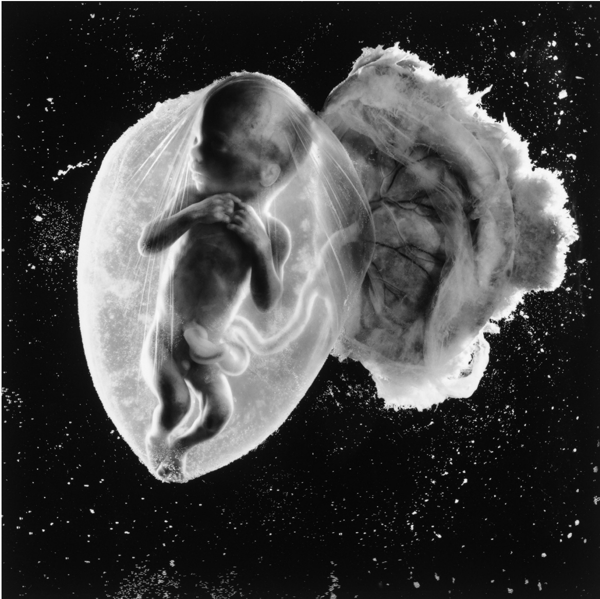
Bild 3: Foetus, 18 weeks (LIFE cover), 1965/2011. 52

Denotation: I centrerad position syns ett foster omslutet av en tunn transparent vävnad. Det fångar och reflekterar ljuset som kommer från sidorna. Fostret har tydligt synbara kroppsdelar och huvudet är proportionerligt större än kroppen. Det håller armarna med lätt knutna nävar mot sig över bröstkorgen. Ansiktet är vänt från kroppen som syns rakt fram ifrån så att profilen med mun och näsa och slutna ögon syns. Navelsträngen syns tydligt och ringlar sig som en geléartad massa från navelpartiet till moderkakan med blodkärl likt förgrenade rottrådar om sig.