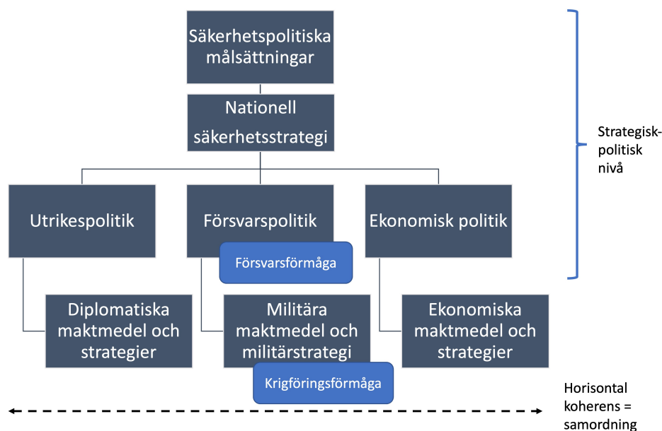
Figur 1: Författarens utveckling av Westbergs modell med beskrivning av relationer mellan säkerhetsmål, övergripande politikområden, strategier och maktmedel kompletterat med var försvarsförmåga och krigföringsförmåga kan placeras utifrån resultatet från denna undersökning.

För att förtydliga var försvarsförmågan uttrycks och formas som strategiskt begrepp har Westbergs modell tillförts en nivå som direkt underordnas den gemensamma säkerhetsstrategin. Ursprungsmodellen delar upp säkerhetsstrategin i politiska, militära samt ekonomiska maktmedel och strategier vilket rimligen innebär att den inrymmer en dimension av varje, d.v.s. tre ”delstrategier” som i modellen ovan åskådliggörs genom sitt politikområde. Härvid har politiska strategier tolkats i första hand som utrikespolitik som del av säkerhetspolitiken. Övriga delstrategier formas inom försvarspolitikerna och den ekonomiska politiken. Vi har dock tidigare konstaterat att försvarsförmåga inte kan begränsas till enbart den försvarspolitiska sfären då internationellt säkerhetspolitiskt samarbete som bekant är en av begreppets byggstenar. Här kommer den horisontala koherensen in då försvarsstrategin lämpligen samordnas med såväl utrikespolitiska som ekonomiska strategier för optimal effekt.