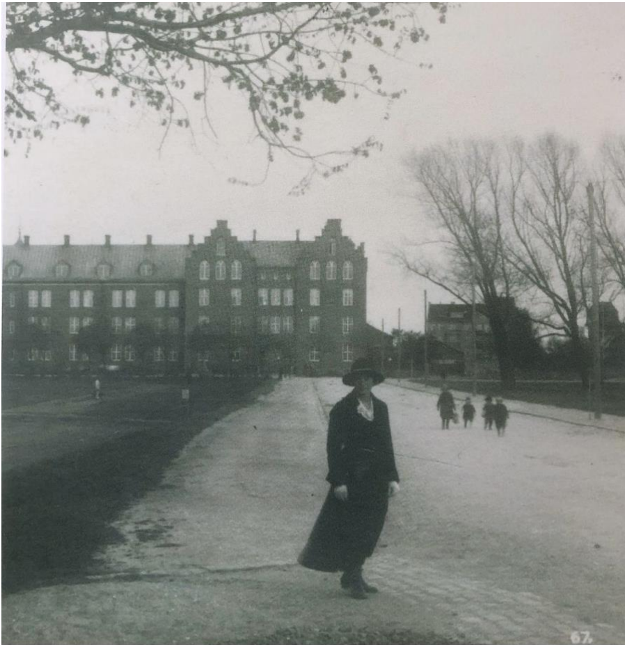
Bild 2. Foto publicerat av Malmö stadsarkiv på Instagram. Publicerat 22-05-04.