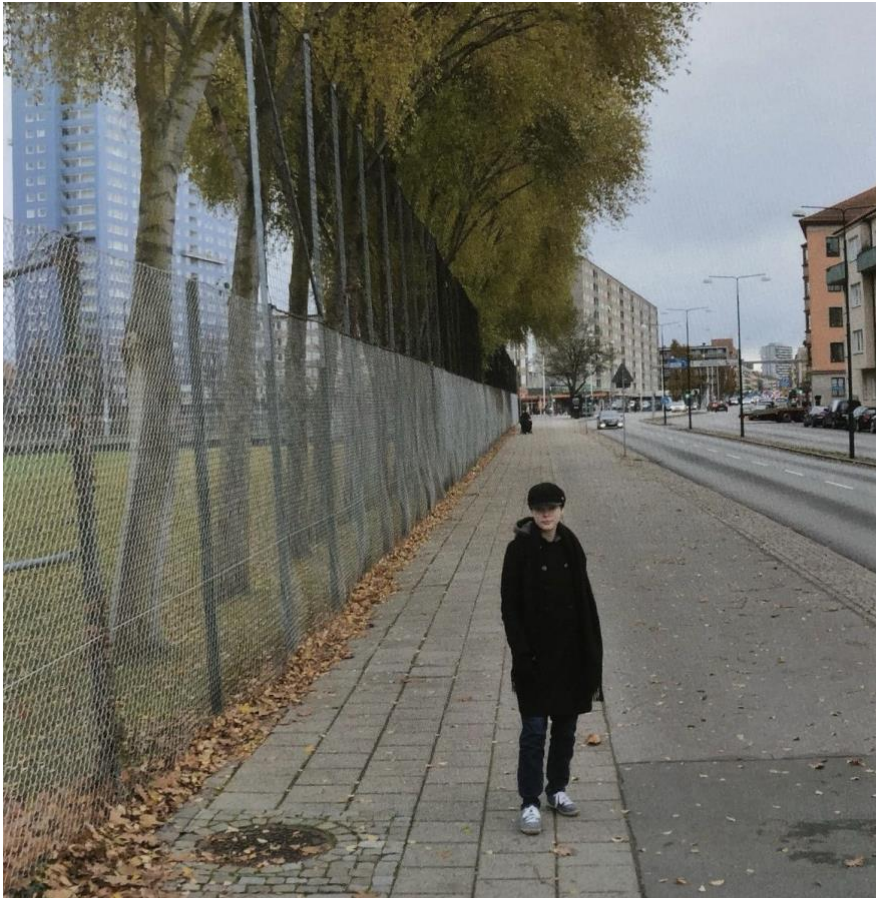
Bild 3. Fotografi publicerat av Malmö stadsarkiv på Instagram. Samma inlägg som i bild 2. Publicerat 22-05-04.