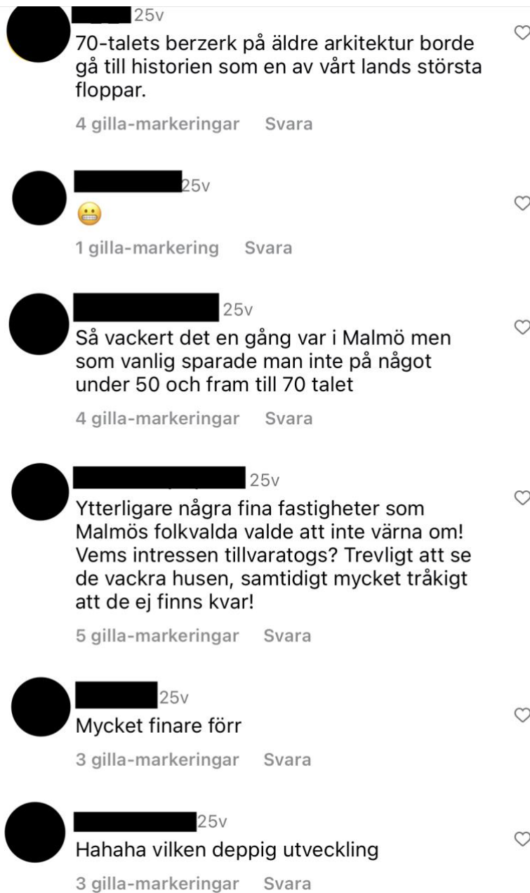
Bild 4. Ett urval kommentarer till ett Instagraminlägg Malmö stadsarkiv publicerat. Inlägget visar ett foto på ett parkeringshus i centrala Malmö samt ett foto från 1920-tal som visar bland annat det 1700-talshus som låg där innan det revs och parkeringshuset byggdes. Publicerat 22-11-19.