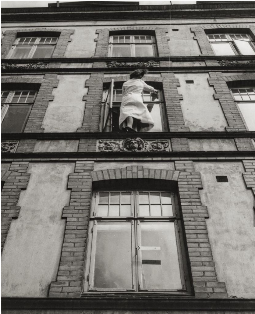
Bild 1. Foto publicerat av Malmö stadsarkiv på Instagram. Publicerat 22-02-15.