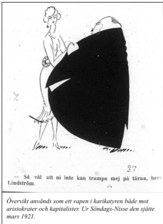
Övervikt används som ett vapen i karikatyren både mot aristokrater och kapitalister. Ur Söndags-Nisse den sjätte mars 1921.

Låt oss dock först säga något lite mer övergripande om hur innehållet hade förändrats i tidningen givet allt som har hänt under åren fram till 1921. Överlag tog politiken – i bemärkelsen det aktuella politiska livet och dess aktörer – mindre plats i Söndags-Nisse 1921 jämfört med 1918. Istället vigde Hasse Z mer utrymme åt sin egen omgivning, det vill säga Stockholms