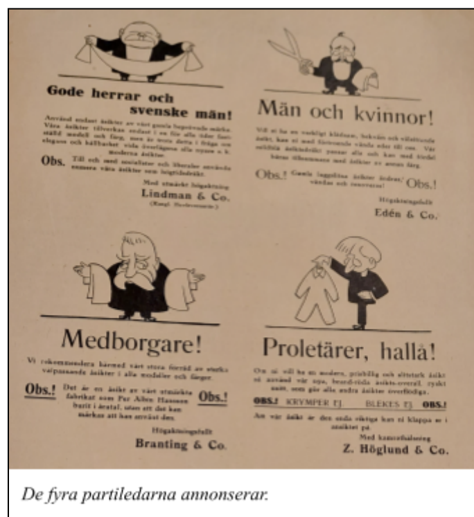
De fyra partiledarna annonserar.

är kvinnor som “har byxor, åker skidor och röker”. Det må verka illa, men å andra sidan är det troligt att framtidens män kommer att blicka tillbaka till 1921 och även de utbrista “O, forna tiders kvinnor!”, avslutar Dinar Annas . 139 Det är uppenbart att Naggen inte såg varken rösträtten eller jämlikheten som någon seger. Det fanns en rädsla för den nya kvinnan, och humorn tjänade mycket till att försöka trycka ner henne. Språket i Naggen som var så färgat av poesi och metaforik – nästan mer 1921 än tre år tidigare – gör det dessutom svårt att tolka några av dessa skämt ironiskt.