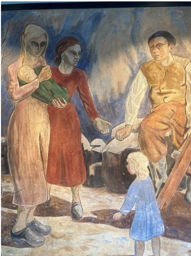
Bild 10: Bertil Landelius, del av April , 1947, al fresco, 3,5 x 8 meter, Folkets hus Malmö, foto: Lowe Smith Jonsson. Den vänstra gruppen.

I bildens vänstra del finns en sista grupp. Här avbildas en flicka placerad i bildens förgrund direkt framför den vilande mannen i den centrala gruppen. Hon har blont hår, ljusblå rutig klänning med vit krage och på fötterna har hon små träskor. Till vänster om flickan står två kvinnor. De bär knälånga formsittande klänningar en i rött och en i rosa. De bär likt de andra kvinnorna träskor men till skillnad från dem bär de ingen huvudduk. Kvinnan i rosa klänning har blont hår och bär ett lika blont spädbarn i sin famn. Spädbarnet är insvept i ett grönt tygstycke. Hon har skarpa ansiktsdrag och läpparna formar ett leende medan ögonen är kraftigt skuggade. Hon tittar ner på den blonda flickan. Kvinnan i röd klänning har det bruna håret uppsatt. Även hon avbildas med skarpa ansiktsdrag men ögonen är inte lika skuggade och det finns en antydning till leende även i hennes ansikte. Hennes kropp tycks vara i rörelse framåt och hon sträcker fram sin vänstra hand med öppen handflata mot den vilande mannen i bildens centrala grupp.