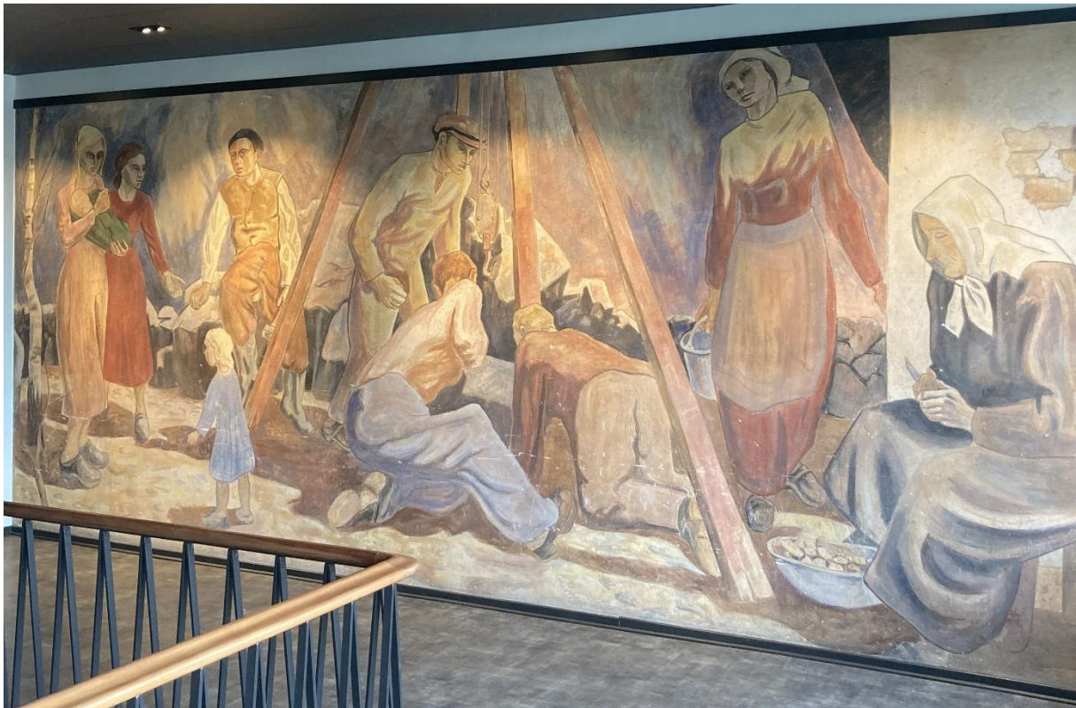
Bild 7: Bertil Landelius, April , 1947, al fresco, 3,5 x 8 meter, Folkets hus Malmö, foto: Lowe Smith Jonsson.

På väggen ovanför trappan upp från Folkets hus foajé till dess andra våningsplan är den monumentala väggmålningen April av Bertil Landelius installerad. Den är 3,5 x 8 meter och är utförd al fresco.