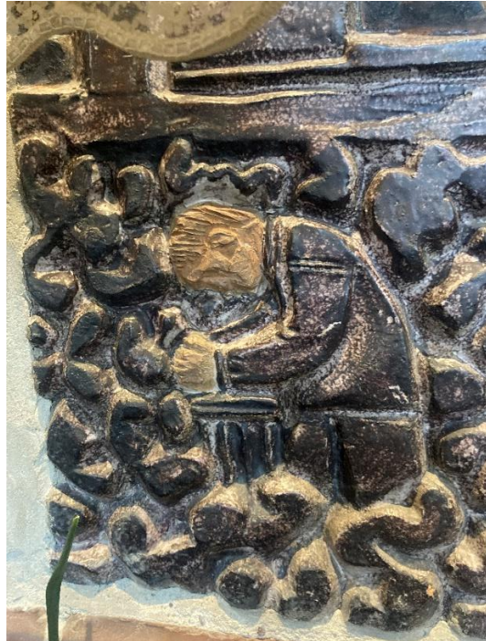
Bild 4 & 5: Robert Nilsson, Arbetarrörelsens historia , 1947, glaserad relief, 2 x 9,65 meter, Folkets hus Malmö, foto: Lowe Smith Jonsson.

Ljuset, här framställt genom solstrålarna, har tre huvudsakliga betydelser i arbetarrörelsens ikonografi. Först och främst är det upplysning, kunskap och civilisation, även kopplad till självförbättring i socialismens tjänst. 47 Den andra innebörden är den nya världen, fylld med alla de positiva värden som den kommande socialistiska världsordningen kopplades till. 48 Sist är den också en symbol för arbetarens frihet. 49 Dessa betydelser är inte uteslutande och interagerar i detta verk. I denna bild vänds alla blickar, och den långa raden män, mot ljuset och det bör därför betraktas som målet, inte medlet. Det symboliserar den nya morgondagen, framtidens socialism.