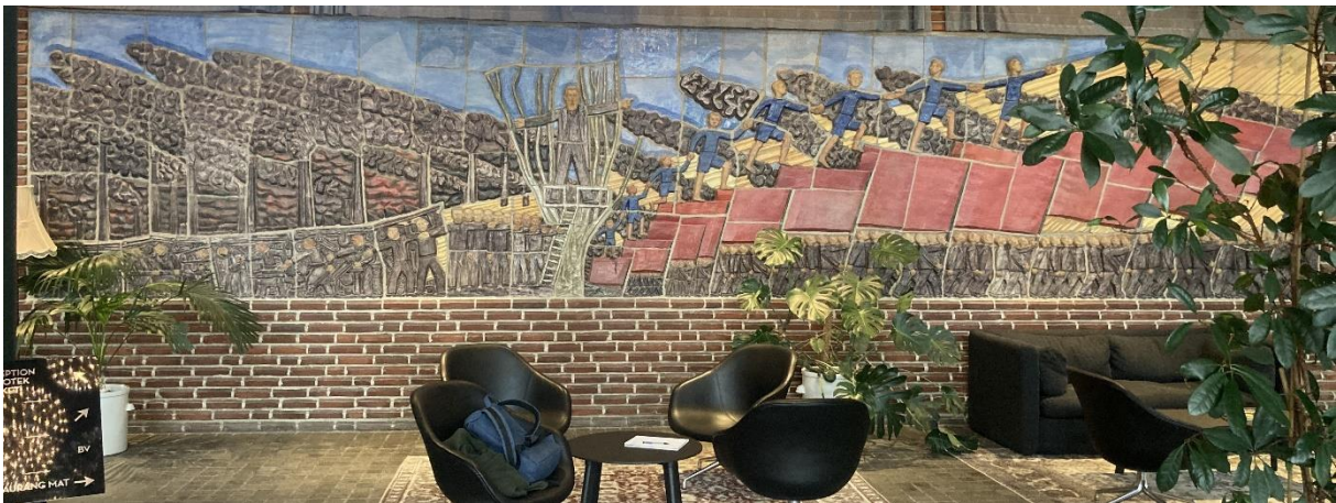
Bild 1: Robert Nilsson, Arbetarrörelsens historia , 1947, glaserad relief, 2 x 9,65 meter, Folkets hus Malmö, foto: Lowe Smith Jonsson.

Det första en besökare på Folkets hus i Malmö möts av den glaserade reliefen Arbetarrörelsens historia av Robert Nilsson som mäter 2 x 9,65 meter. Bilden föreställer en två parallella rörelser. Svarta rökmoln som driver vänsterut i bilden från mörka skorstenar och arbetare som från de djupaste mörkret i fabriken bryter sig fria och ledda av en agitator marscherar mot solen.