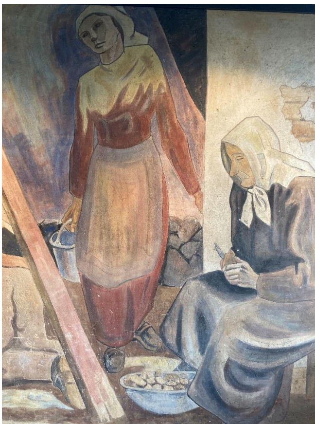
Bild 8: Bertil Landelius, del av April , 1947, al fresco, 3,5 x 8 meter, Folkets hus Malmö, foto: Lowe Smith Jonsson. Den högra gruppen.

fritt men resten täcks av en vit huvudduk. Hennes ena fot är synlig och den bär en träsko. I högra handen fattar hon en liten kniv och med den skalar hon en potatis. Mellan sina ben har hon en bunke fylld med skalade potatisar. Hennes ögon är riktade mot arbetet och det fårade ansiktet har ett koncentrerat uttryck. Runt det vitputsade hörnet avbildas gruppens andra kvinna. Hon bär också en heltäckande klänning, hennes kropp får dock lite mer form då den spänns åt kring midjan av ett förkläde. Även hon bär träskor och har sitt hår täckt med en vit huvudduk. Hennes klänning har en röd klar färg i kontrast mot den andra kvinnans gråsvarta. Kvinnans kropp är spänd och böjs till höger. I höger hand bär hon en hink som tycks vara vad som tynger ner henne. Hennes ansikte är avbildat med skarpa former i ett spänt uttryck.