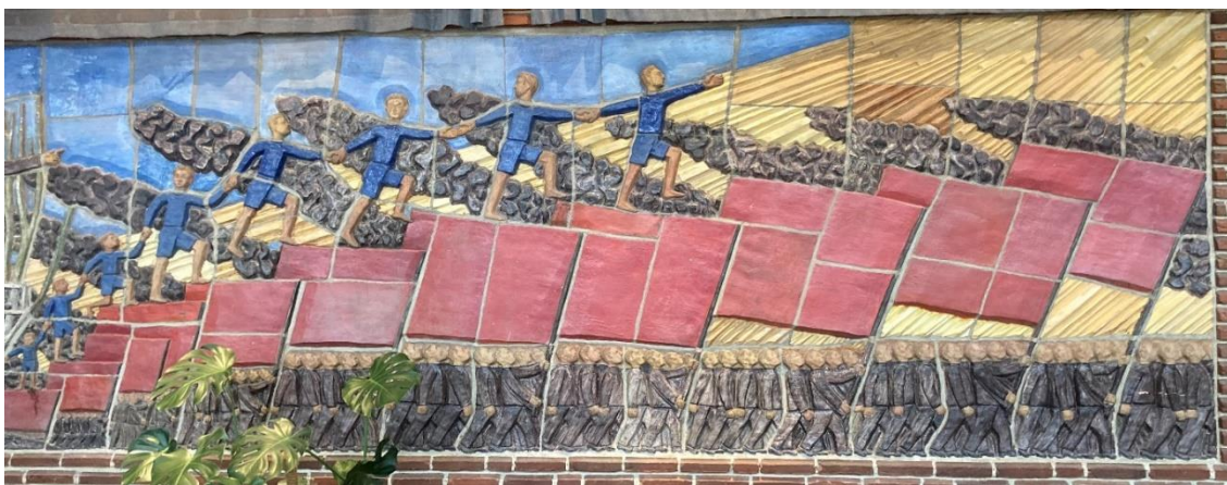
Bild 3: Robert Nilsson, Arbetarrörelsens historia , 1947, glaserad relief, 2 x 9,65 meter, Folkets hus Malmö, foto: Lowe Smith Jonsson.