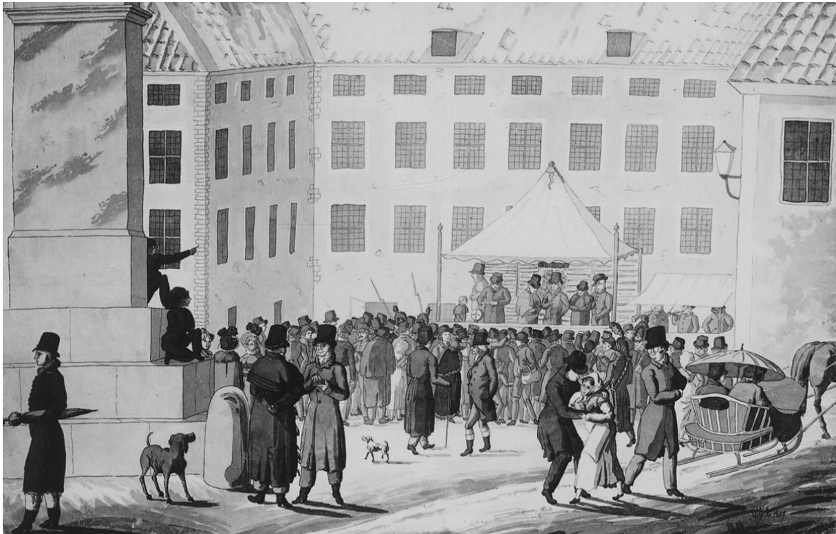
Dragning i nummerlotteriet vid Indebetouska huset i Stockholm år 1819.

hörde en åskådare ”försända Lotteriet i h_ och bedyra, att, om Assistancens penningar ej bli lyckligare nästa gång, så har han icke mera någon rock att sätta in”. 178 Närheten till slottet ifrågasattes. Man borde inse ”olämpligheten af, att, i ett så nära grannskap med Konungens fridlyste borg, anställa sådane spectacler som lotteriets hvarje 3:dje vecka skeende dragningar, hvarunder støj och oljud, ja, ofta våldsammare uppträden, icke lära uteblifvit”. 179