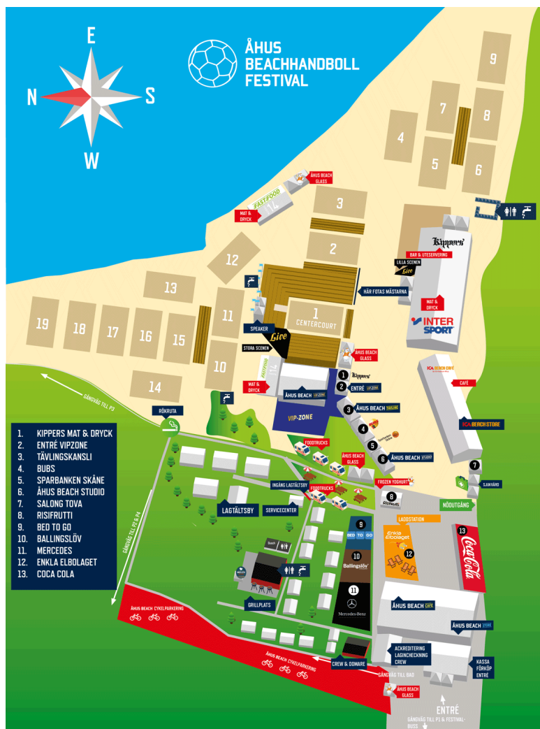
Figur 2, Åhus Beachhandbolls festival (Åhus Beach AB, 2019).

personer (Ibid.). En dags biljett till Beach Handbollsfestivalen kostar 130 kr för de mellan 13–18 år och 165 kr för de mellan 18–65 år. För Åhus Beachfotboll Festival kostar endagsbiljetten 65 kr för de mellan 13–80 år (Åhus Beach AB, U.Å.a). Åhus beach inträffar varje år i juli månad under en 18 dagars period på Evenemangsstranden. Arrangemanget kräver stort engagemang och innebär ett behov av såväl volontärer som anställda, vilka beräknas uppgå till cirka 200 personer varje år (Åhus Beach AB, U.Å.b). Utöver idrottsevenemangen fylls Evenemangsstranden under dessa 18 dagar med restauranger, en tältby för deltagande lag, spelplaner samt montrar med aktiviteter arrangerade av företag. Mats G Jönsson som idag är: verklig huvudman och styrelseledamot i aktiebolaget Åhus Beach AB (Bolagsfakta, U.Å.) var först i Sverige med att förvandla en ideell handbolls verksamhet till ett aktiebolag i mångmiljonklassen (Solfors, 2016). Kartan nedan Figur 2 redovisar området under Beachhandbolls festivalen.