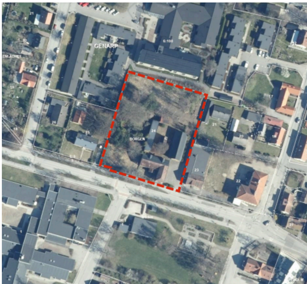
Kartan visar ett ortofoto över centrala Genarp med tomten Borgen 24 markerad i rött.