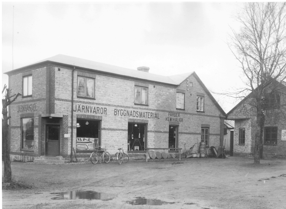
Bild 2. Järnhandeln

Bilden visar den gamla Järnhandeln i Genarp som den såg ut någon gång under 50-talet. Huvudbyggnaden som visas på bilden står fortfarande kvar och har varit en viktig aspekt i diskussionerna kring den nya detaljplanen över Borgen 24. Lunds stadsarkiv. (u.å). Järnhandeln i Genarp, 1950-talet.