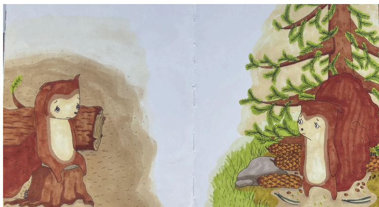
Bild 8. Läsaren uppmanas till perspektivtagande. Illustratör: Tilla Gellner

Vad tycker du att Elof och ekorrarna i den skövlade skogen ska göra? Vad tycker du att Ella och ekorrarna i den levande skogen ska göra?