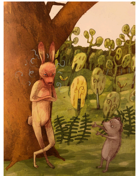
Bild 4. Empatisk process.