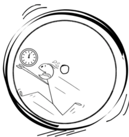
Fig. 1. En samhällsmedborgare fast i “ekorrhjulet”, det som i titeln återspeglar en hamster och sitt hamsterhjul. Med denna illustration vill vi belysa hur individen är begränsad av materiella gränser och hur den jagar efter tiden som idag i vår mening blivit ett privilegium (designad av Filippa Gunnarson).

Kalle föds, går i skolan tills han tar studenten, pluggar på universitet och kommer ut i arbetslivet. Det han inte vet är en värld som väntar honom där han kommer betraktas som en prestationsmaskin och en hamster i ett hjul. Hjulet symboliserar samhällets accelererande tempo där Kalle måste springa snabbare i hjulet för att hinna med resten. Kalle vill bromsa men det är för sent, han är redan för trött.