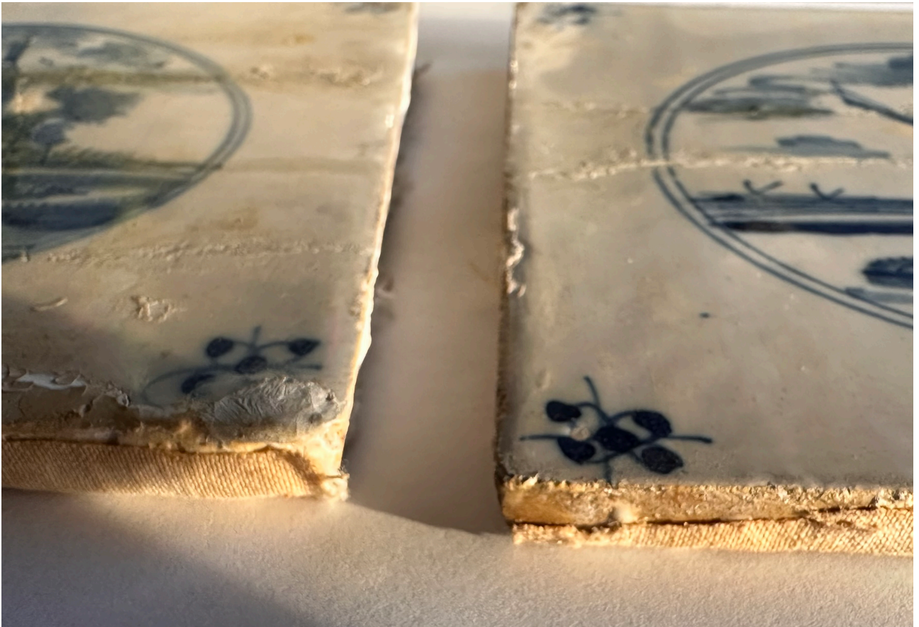
Bild 4: Närbild av kakelplattornas material, Lindholmens badhus, Kållandsö, 1600-tal, Holland, 13x13 cm