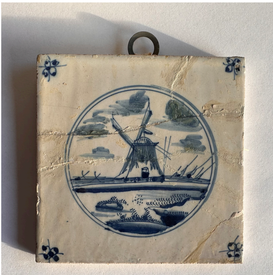
Bild 3: Detaljbild av kakelplatta II, Lindholmens badhus, Källandsö, 1600-tal, Holland, 13x13 cm