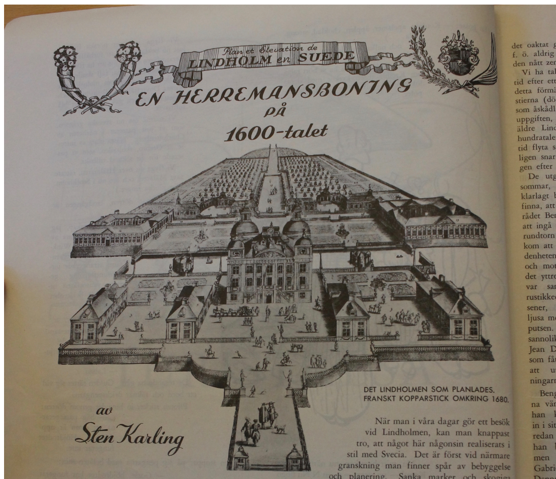
Bild 9: Lindholmens slott med tillhörande slottspark, fransk gravyr, omkring år 1680, Julskeppet: Göteborgsjournalisternas jultidning , 1931

det oaktat gl f. ö. aldrig s den näst zen Vi ha tala tid efter ett detta förmål stierna (död som åskådlig uppgiften, e äldre Lind hundratalet tid flyra sp ligen snart gen efter d De utgr sommars, h klarlagt be finna, att o rådet Beng att ingå m rundtor kom att s denhetens och mot det yttre var sam rustikked sener, s ljusa mo putsen. sannolikt Jean De som fått att ut ningarna Beng na vänt han ka in i sitt redan han b men Gabrie Denne