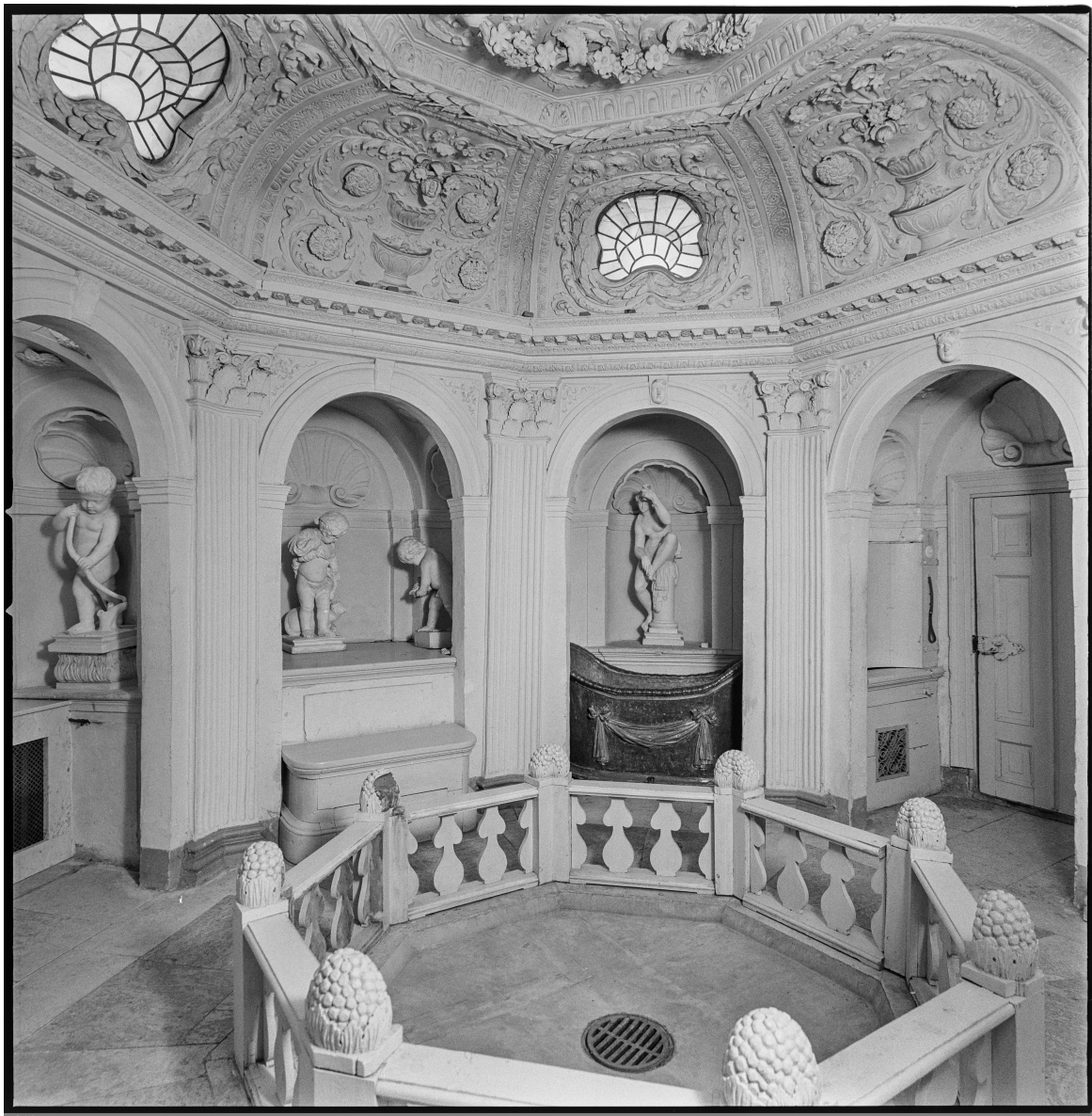
Bild 7: Ericssbergs slott, interiör av badrum, fotografi, Foto: Erik Liljeroth, Nordiska museet

golvet såsom det har beskrivits att det ska ha sett ut i Caldarium . Kersti Holmqvist, svensk konsthistoriker, beskriver badrummets utveckling i Fataburen (1970), en kulturhistorisk årsbok som utges av Nordiska Museet i Stockholm. I kapitlet citerar hon Linnés beskrivning av Lindholmens badhus och tar upp detta som ett exempel på hur badrum och badhus kunde se ut under sent 1600-tal och 1700-tal. Holmqvist redogör för hur man kan likna Linnés beskrivning av Lindholmens badhus vid det badrum som återfinns i en av flyglarna på Ericssbergs slott i Sörmland, troligtvis uppförd 1670. 23 Beskrivningen av badrummets utseende i kapitlet motsvarar Linnés återgivning av Caldarium med hjälp av både fotografier och ritningar. Av fotografiet nedan (bild 7), av Ericssbergs Caldarium , att döma är det därmed också med stor sannolikhet inte heller Caldarium som är