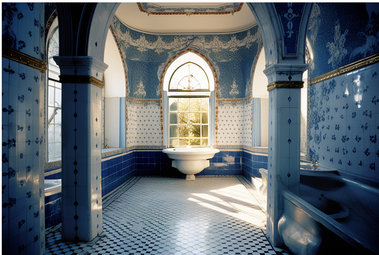
Bild 10: Lindholmens badhus, Karin Hamberg Sten, Generativ AI, Midjourney, 2023