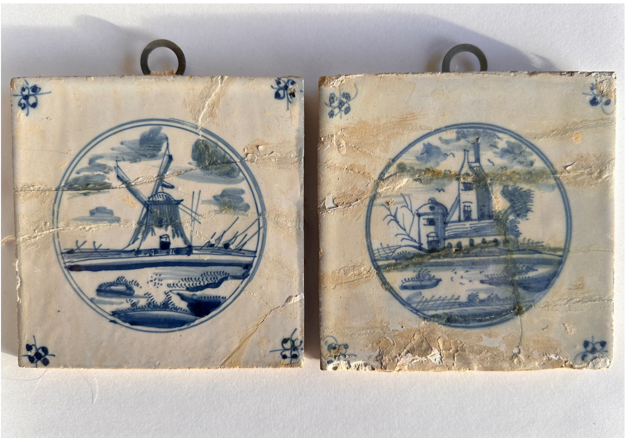
Bild 5: Kakelplatta I och II sida vid sida, Lindholmens badhus, Kållandsö, 1600-tal, Holland, 13x13 cm