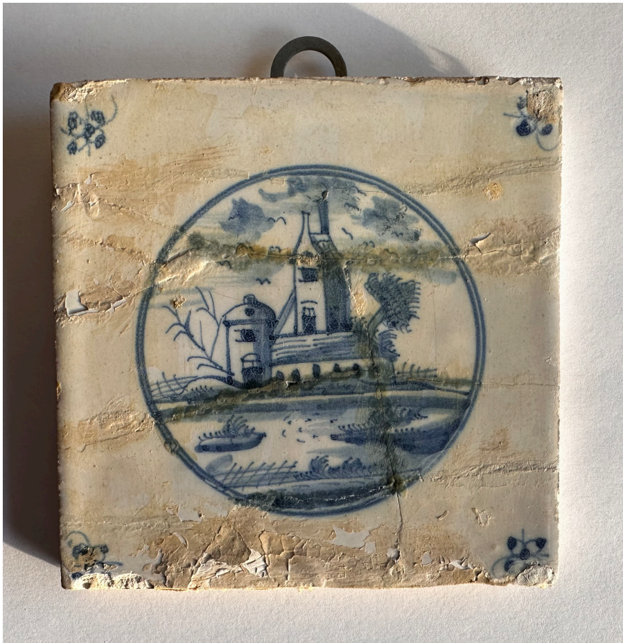
Bild 2: Detaljbild av kakelplatta I, Lindholmens badhus, Källandsö, 1600-tal, Holland, 13x13 cm