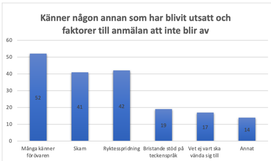
Tabell över andelen respondenter som känner någon annan som blivit utsatt för sexuella övergrepp samt vilka anledningar de angav bakom att anmälan inte blev av.