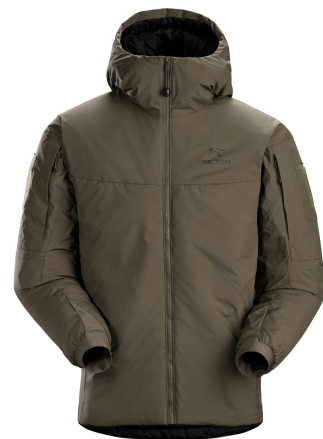
Bild 9. Arceteryx Leaf