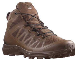
Bild 6. Salomon Force Speed Assault 2

”...sedan jag kom till Flygbasjägarkompaniet har jag inte sett en känga 90, så jag bedömer att alla tycker den är skit då...”