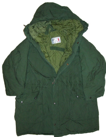
Bild 7. Värmejacka 90