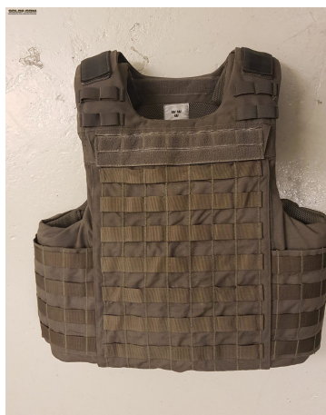
Bild 4. Kroppsskydd 12

”...vi använder inte Stridsväst 2000 på kompaniet. Kompaniet har köpt in andra stridsvästar till vissa patruller...” Informant #5, Flygbasjägarkompaniet