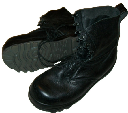
Bild 5. Marschkänga 90

Beroende på vad tjänsten och uppgiften innebär så köper man det som passar för just det. Här skiljer det sig mellan förbanden hur man ser på vad för skodon man använder. På jägarförbanden har man ingen styrning, utan den enskilde använder det som den enskilde anser passar bäst för tjänsten. Här har märket Salomon blivit väldigt populärt. Medan Bassäk på Marinbasen har en policy där det styr upp att svarta kängor med högt skaft är det som gäller vid anskaffning av egna kängor.