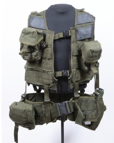
Bild 3. Stridsväst 2000