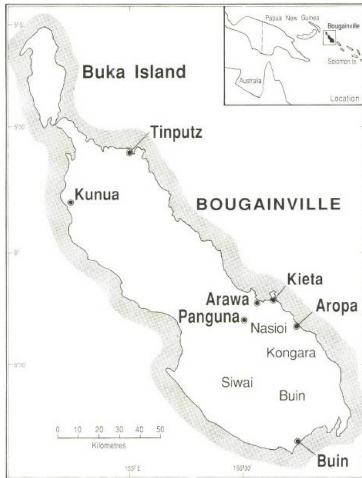
Figur 2: Karta över öarna Buka och Bougainville. 28