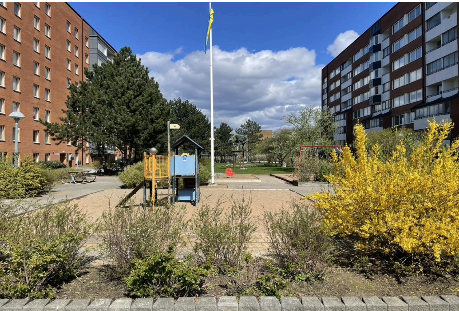
Figur 1: Lekplats i MKBs område på Kroksbäck.