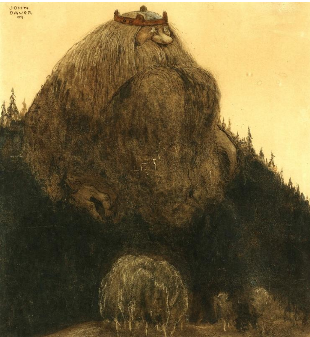
Picryl 1, u.å