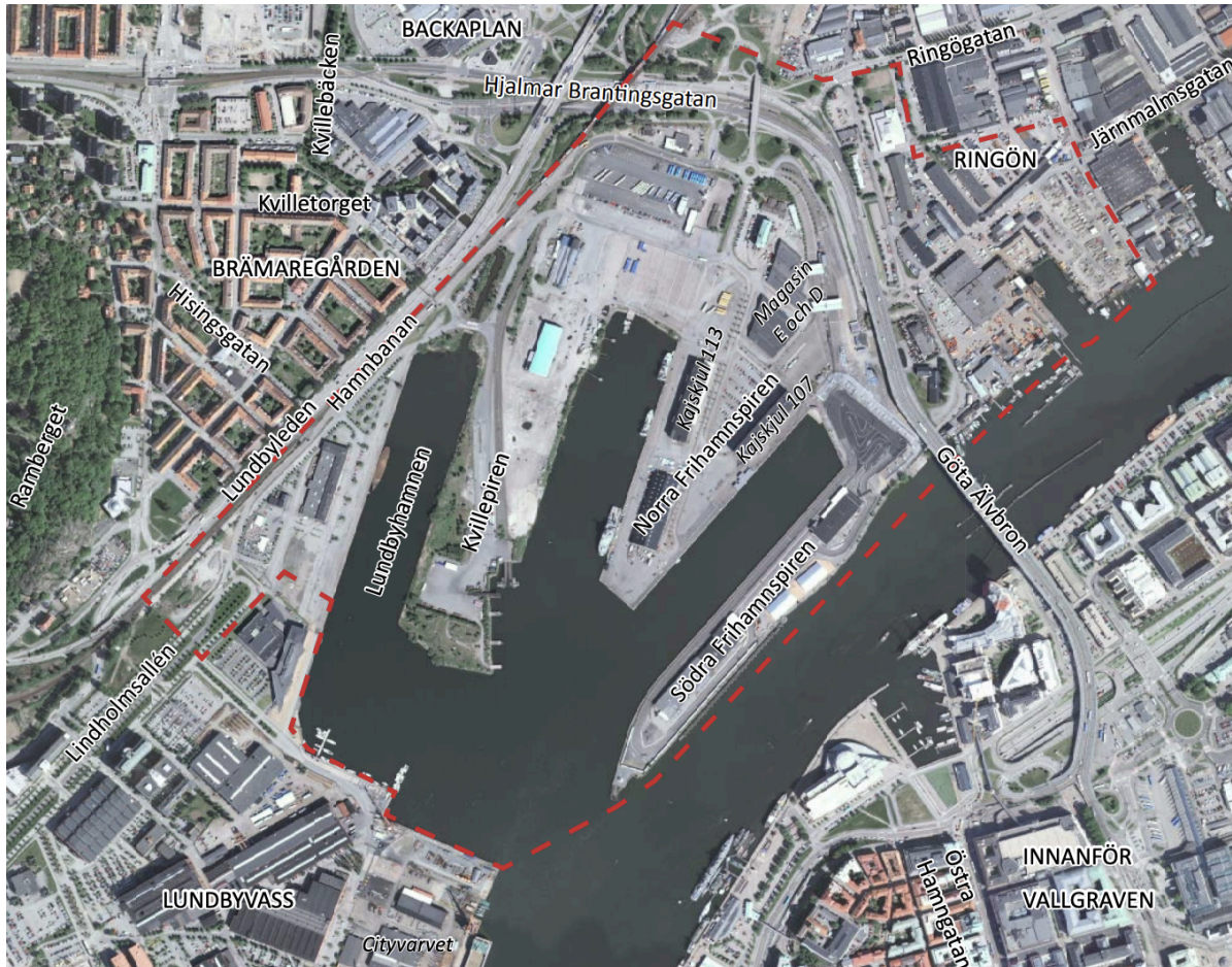
Figur 2: Program områdets avgränsning av Frihamnen i Göteborg (rödmarkerat område)

Området avgränsas tydligt av stadsområdet Lindholmen i väster och Hisingsbron i öster och i norr Lundbyleden. Arbetet kommer att fokusera på Jubileumsparken framväxt som i detaljplanen är geografiskt placerad vid spetsarna på de tre pirerna men som idag har fått en lokalisering längre in vid hamnbassängen (Göteborgs Stad et al. 2016).