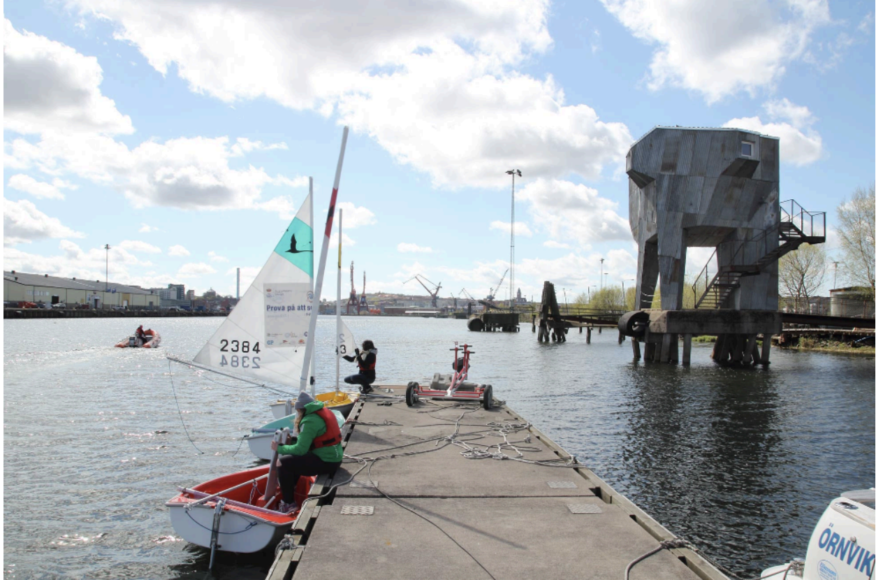
Figur 5. Seglarskola som drivs av den ideella organisationen Passalen & till höger prototyp-bastun.