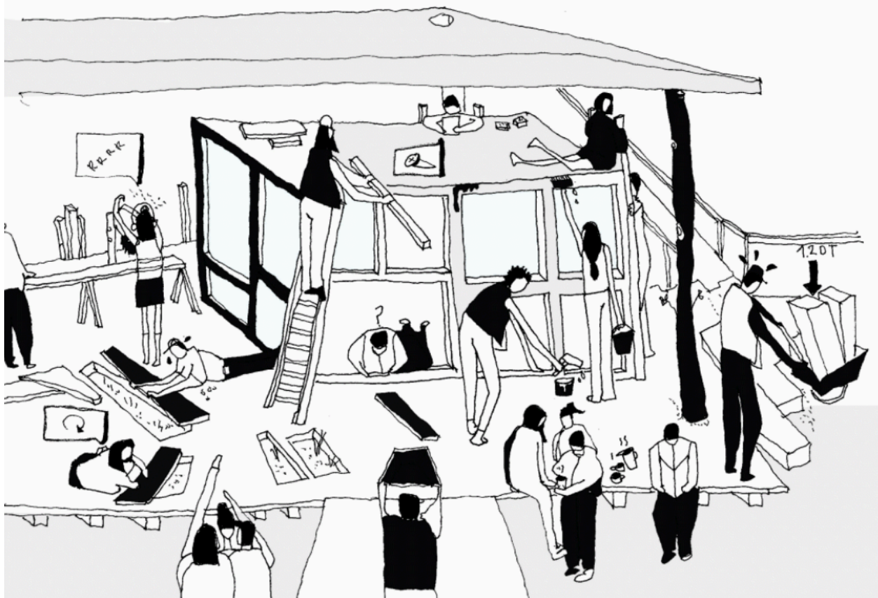
Figur 4. Illustrerar byggandet tillsammans Foto: Raumlabor (2014)

av Frihamnsområdet. Prototypfasen, även kallad Projektet platsbyggnad, var en central del av arbetet med visionen Älvstaden och utvecklingen av Frihamnen (Göteborgs Stad 2014b). Platsbyggnad beskrivs som ett verktyg för att skapa en övergång mellan planering och genomförande av projektet. Metoden Platsbyggnad testade olika platsskapande aktiviteter i form av prototyper. I boken Prototypa beskrivs metoden D-I-G (doing in groups) som utgick ifrån att göra en sak eller plats i mindre grupper genom olika taktiker (Dahl, Olsson 2023). Förutom bad och bastu fanns prototyper för strand, odling och seglingsskola som ett test inför planeringsarbetet av Jubileumsparken. Sedan 2021 var det bestämt att vissa delar av Jubileumsparken skulle permanentas. En utflyktslekplats med tillhörande skulpturer, badet med tillhörande omklädningsrum och en ny bastu inspirerad av prototypbastun blev bestående (Ibid).