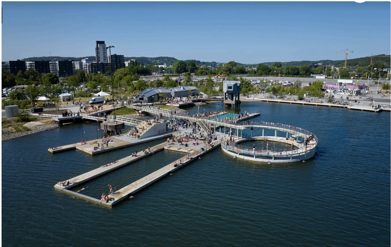
Figur 3: Hamnbadet i Jubileumsparken