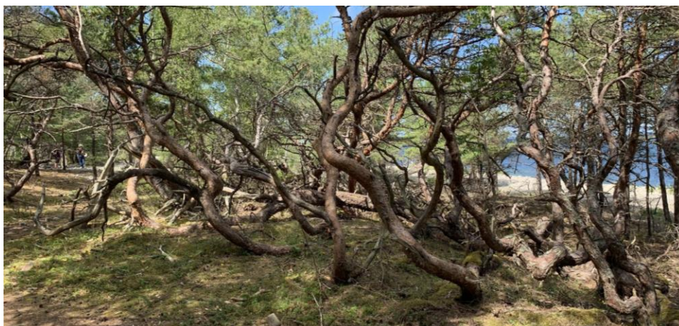
Figur 3: Trollskogen

Bild på gamla stormvridna tallar i reservatet .