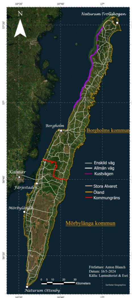
Figur 2: Karta över Öland

M. Larsson, (personlig kommunikation, 16 april 2024) nämner att ca 70 000 besökare besöker reservatet årligen. Reservatet finns på öns nordostligaste udde, där många hotade och ovanliga arter finns bland reservatets gamla tallskog (se figur 3), exempelvis Ädelkronlaven ( Gyalecta carneola ) (Länsstyrelsen Kalmar, u.å.-c; SLU Artdatabanken, 2024). I reservatet finns tre markerade vandringsleder och naturum Trollskogen (se figur 2) där man kan få information om den biologiska mångfalden i området, och de föreskrifter som är aktuella inom reservatets ramar (Länsstyrelsen Kalmar, u.å.-c).