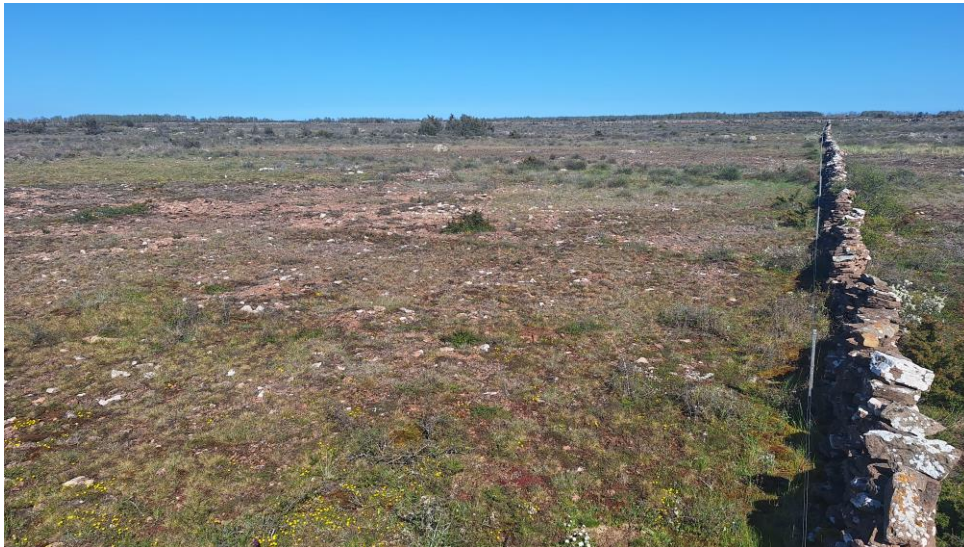
Figur 5: Alvaret

Skyddade områden som natura 2000-områden finns i hela EU, och har med direktiv och konventioner som mål att skydda värdefulla naturtyper och arter (Naturvårdsverket, 2023f). I Sverige finns cirka 4000 natura 2000-områden, vilket omfattas av omkring sju miljoner hektar (Naturvårdsverket, 2023f). ”Stora Alvaret” (se figur 2 och 5) är ett av Ölands natura 2000-område, som med en area på 260km 2 tar upp en stor del av södra Öland (Länsstyrelsen Kalmar, 2016). Stora Alvaret har med sin kalkrika berggrund, tunna jordar och låg nederbörd har skapat ett landskap som består av unika växt- och djurarter (Länsstyrelsen Kalmar, 2016). Det är uppskattat att cirka 580 rödlistade arter finns på alvaret, samt ett flertal endemiska arter som Alvarmalört ( Artemisia oelandica ), och Ölandsmåra ( Galium oelandicum ) (Länsstyrelsen Kalmar, 2016).