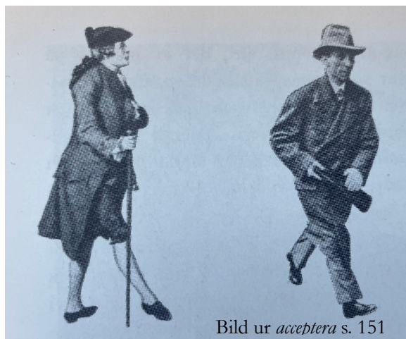
Bild ur acceptera s. 151

Människans naturlighet kopplas i acceptera i många fall till koncept som modernitet och utveckling, såväl på samhälls- som individuell nivå. Det finns många exempel på hur författarna uppfattar att det ”lilla” individuella livet ska uppbära de ”stora” samhälls- idéströmningarna. När författarna i kapitlet ”Kravet på bostaden” systematiskt beskriver vilka behov hemmets