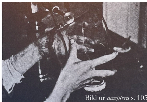
Bild ur acceptera s. 105

Användandet av naturlighetsbegreppet i relation till stilideologi gör att det blir relevant att analysera konsekvenser av argumentationen ur ett maktperspektiv. Vem som får möjlighet att uttala sig om innebörden i naturlighet, och utifrån vilka ideal detta förväntas införlivas påverkar budskapet i