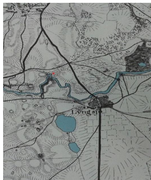
Fig3. Utdrag ur Skånska rekognoseringskartan och den moderna fastighetskartan över Lyngsjö som visar landskapets förändringar.

Det känns som att närvaron av vatten borde ha spelat roll, eftersom majoriteten är markerade nära vatten. Det kan också vara en tillfällighet och att