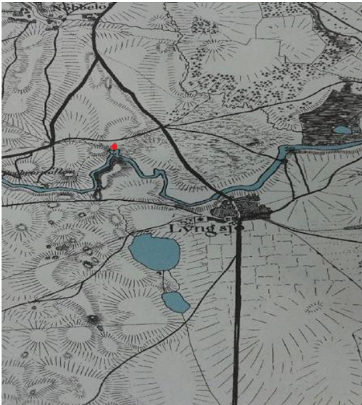
Fig2. Utdrag ur Skånska rekognoseringskartan och den noderna fastighetskartan över Lyngsjö som visar landskapets förändringar.

Avrättningsplatserna benämns ofta vara belägna på en kulle eller backe och genom att ha studera det närmare, anser jag det både logiskt och effektivt. Men fallet ser något annorlunda ut. Dock skrivs det även ofta om scener där avrättningen ska ha tagit plats, och när man pratar om höjder kan det vara dessa höjder man menar. Ibland har naturliga höjder i landskapet