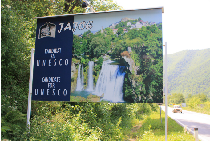
Candidate for UNESCO. Foto: Dragan Nikolić 2010

Vid mitt sista fältbesök i Jajce, i augusti 2010, förundrades jag över de enorma billboards vid sidan av vägen. Det var en pretentiös marknadsföring: 'Candidate' for UNESCO . Som en "metacultural production" med "'the list' as the most visible material outcome", med Kirshenblatt-Gimblett's ord (2004) talar skylten om för förbipasserande hur staden vill se sig själv. Det påminner inte så lite om den önskepolitik som ligger i staten BiH:s strävan att få status som kandidatland till EU. Men i juli 2009 blev Jajces kandidatur till UNESCO:s världsarvslista indragen. Hur gick det till?