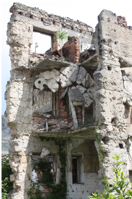
Dinosaurie. Krigsruinerna i Aleksa Šantićsgatan.

Mostars berömda skald Aleksa Šantić (1868–1924) har givit namn åt Šantićsgatan med dess alléer av grönskande träd. Han var en serbisk poet som bland annat skrev Emina , kanske den mest kända och vackraste bosniska sev-dalinka folksången. Den handlar om en omöjlig kärlek mellan den muslimska flickan Emina och den ortodoxe ynglingen – Aleksas alter ego.