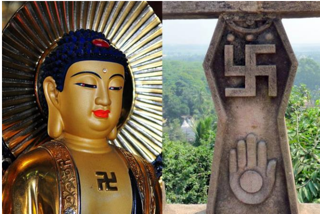
Buddha med svastika och svastikan i buddistisk helgedom.

Som det går att se i denna bilaga är det inte alltid lätt, eller för den delen korrekt, att tillskriva en symbol tillhörighet till en enda otvetydig idéströmning, rörelse eller ett enda meddelande. Det blir här extra tydligt hur viktigt sammanhanget i vilken symbolen burits måste vara vid en rättslig bedömning. En svastika buren på en jacka vid en högerextrem demonstration där slagord av rasistisk art ropas, bör klart presumera att bäraren vill förmedla ett budskap som faller inom HMF-lagstiftningen. En svastika buren av en buddistisk munk vid en ceremoni i ett svenskt buddisttempel bör inte kunna ge en fällande HMF-dom. Detta tankeexperiment ger att samma symbol torde ge två olika presumerade utfall. Därmed måste slutsatsen bli att symbolen i sig inte kan ligga till grund för en rättssäker dom och att sammanhanget i vilken den förekommit är en mer korrekt väg att gå.