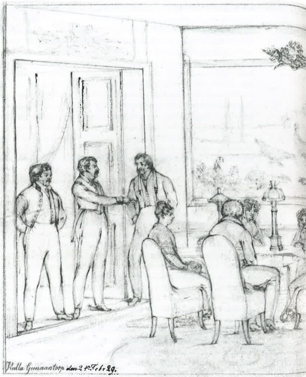
Kulla Gunnarstorp den 2. Febr. 29.