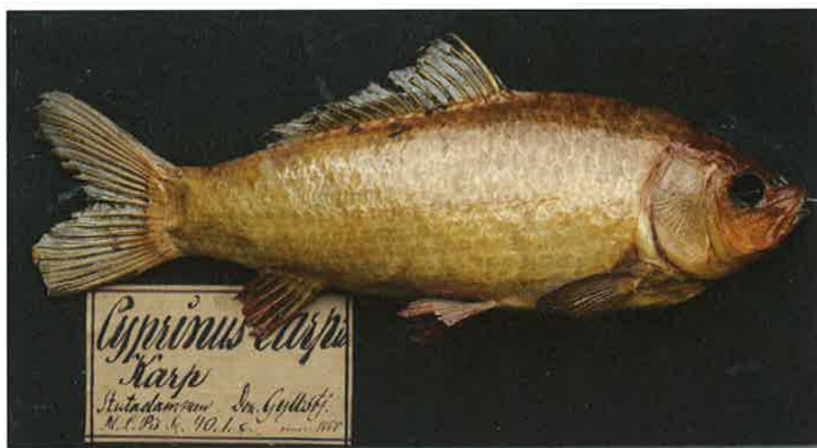
Karp införlivad med Gyllenstiernas fiskkabinett. Zoologiska museet i Lund.

Att en fiskares fångst bars in i herrskapsgemaken så att gästerna fick titta på ett sällsynt exemplar hängde inte bara ihop med att fisket var en väsentlig del i godsekonomin på både Krapperup och Kulla Gunnarstorp. Godsherren Gyllenstierna hade ett avsevärt intresse för fisk, som bland annat yttrade sig i en växande samling, både uppstoppade och inlagda i sprit. Sommaren 1830 gästades också Krapperup av vaktmästare Lindberg från Lunds universitet, som stoppade upp fiskar ”mästerligt” och hjälpte till att sätta ”fiskkabinettet” i ordning. Under studier i naturalhistoria i