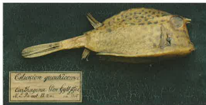
Koffertfisk från Gyllenstiernas fiskkabinett. Zoologiska museet i Lund.