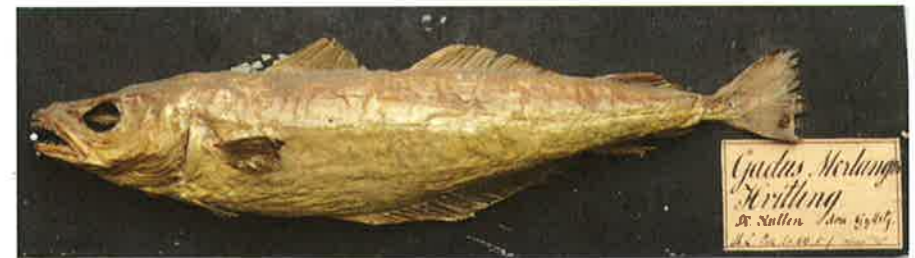
Gyllenstiernas fiskkabinett innehöll både vanliga och ovanliga fiskar, de flesta fångade i välkända vatten. Här en vitling fångad vid Kullen. Zoologiska museet i Lund.