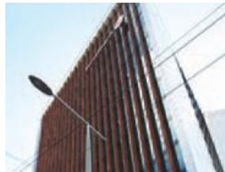
Swedbanks lokaler i centrala Vilnius.

En kvinna, född på 20-talet i en rik storbondfamilj, berättar om sina bitvis oerhört skrämmande erfarenheter av 1900-talet. Hon är efter ett långt liv emellertid inte längre rädd för att tala, och hennes nyfikenhet under det första mötet med någon "från andra