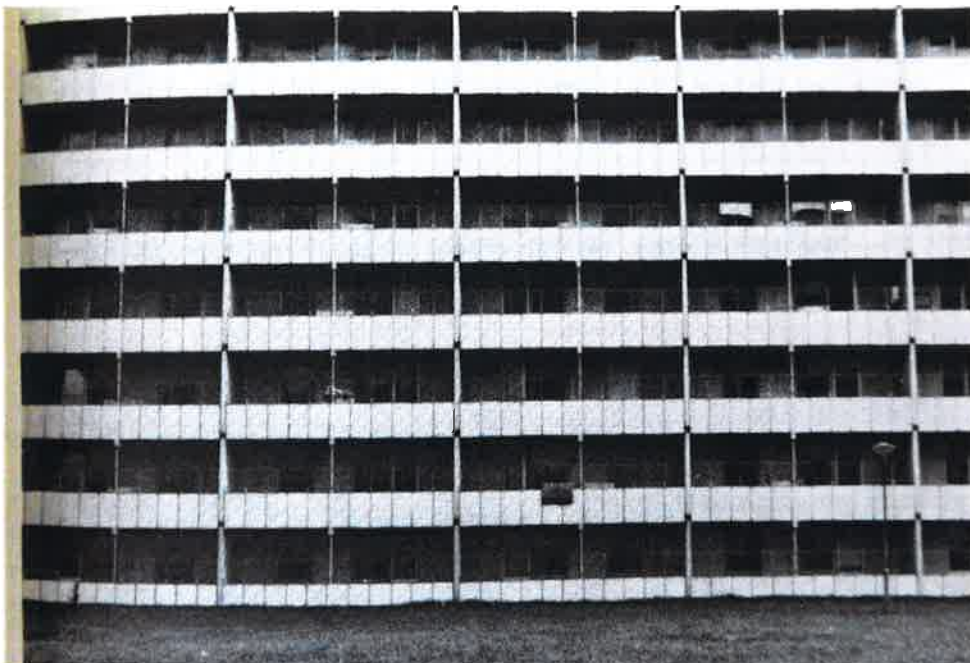
Källa: Alexandersson, Gustav, Dalholm, Elisabeth, Roos, Hans-Edvard, Rudvall, Göte, Swedner, Harald & Werner, Bo (1988). Vad hände i Kroksbäck? En bok om samhällsarbete och aktionsforskning. Rapport 1988:2. Göteborg: Institutionen för socialt arbete, Göteborgs universitet. s. 51.

balkongväggar i betong, och stora diken av gator kring området – Stalinallén – som gör att jag måste ta mig upp för en brant trappa för att komma in i området. Jag ser gardinlösa fönster i de många tomma lägenheterna. Jag ser likaledes tomma garage då man inte vågar ha bilarna utom synhåll, jag ser smala källargångar i rå betong – suckarnas gångar – som man måste ta sig igenom från garagen till den egna lägenheten. I markplanet ser jag ventilationstrummor från garaget där avgaser sipprar ut direkt till barnens lekplatser. Jag ser skadegörelse på bilar, nedklottrade entréer, nedtrampade blomsterrabatter och en stereotyp växtlighet. Jag har hört att faran för mordbränder gör att vindarna hålls låsta. Hyresgästerna kan endast söka upp sitt vindsutrymme i sällskap med vaktmästare från MKB (Malmö Kommunala Bostadsaktiebolag). Jag känner blåsten som viner mellan höghusen och jag ser fasadernas spruckna, tunga och skarpkantade asbestplattor. Jag ser pensionärer blåsa omkull i kastvindarna mellan husen och hur en nedfallande asbestplatta precis missar en gående gammal man. Jag ser en total frånvaro av mötesplatser, butiker, service och arbetsplatser.