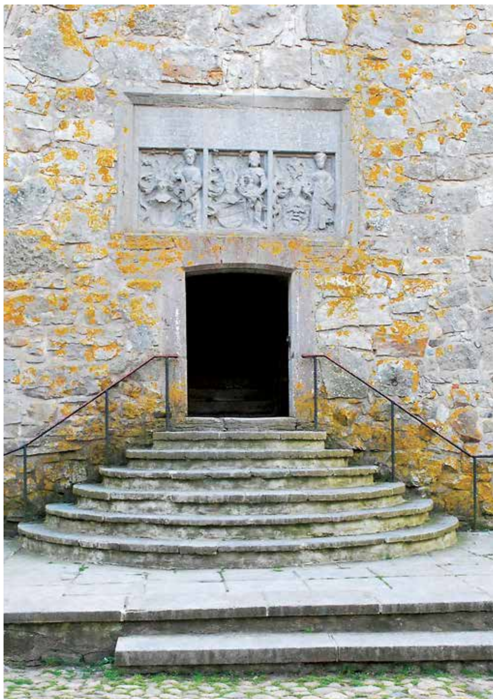
Figur 8. Ingången till Glimmingehus med en stor stentavla med text som berättar att borgen började byggas 1499 av Jens Holgersen Ulfstand. Jens är avbildad som riddare mellan sin döda hustru Holmgerd på sin högra sida och sin dåvarande hustru Margareta på sin vänstra sida.