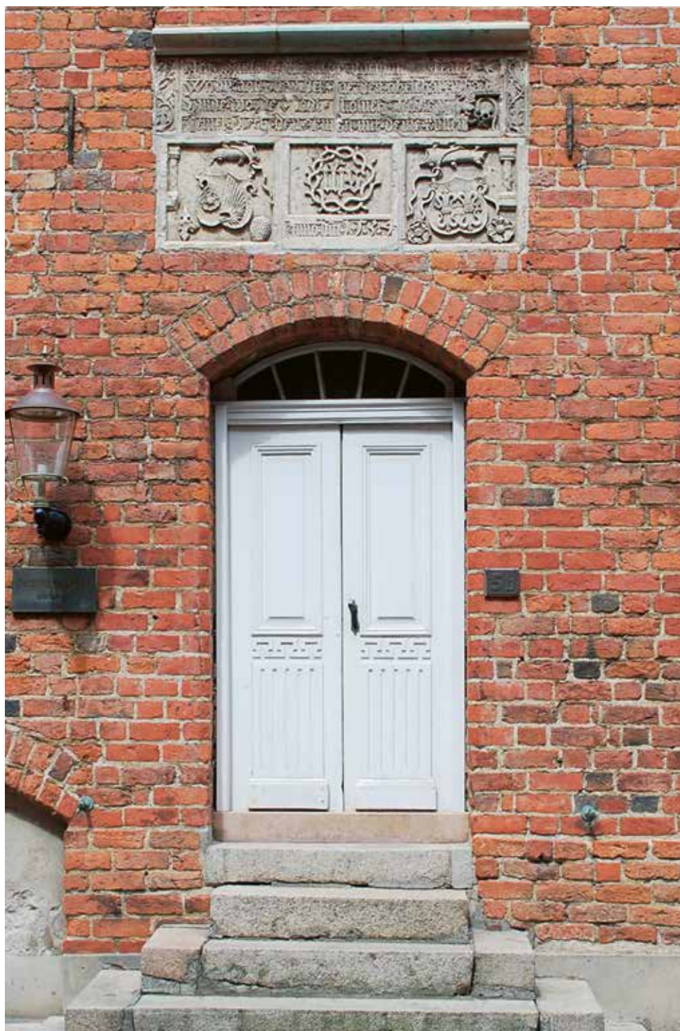
Figur 1. Stentavlan vid Rosenvinge-huset i Malmö.