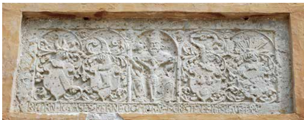
Figur 5. Stentavlan med Treenigheten från Bjersjöholm, daterad 1576 och med vapensköldar från familjerna Kaas/Björn/Rotfeldt/Hoeg.

bok i latin. 27 Denna bok och andra tryckta samlingar av texter och bilder fungerade som modeller för de hantverkare och konstnärer som arbetade med utsmyckningar. Ett exempel är den inskrift som Malmös borgmästare Hans Sukkerbagare satte upp på sitt hus 1581. Förutom hans bomärke fanns här ett välkänt ordspråk som även förekommer på många byggnader i Tyskland (se figur 4). 28