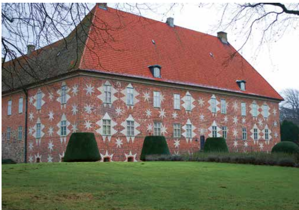
Figur 6. Fasaden av Krapperup med de vita "Gyllenstjärnorna". 2015.

del geometriska figurer. Ibland är ägarnas bomärken skurna inom en ram av linjer eller en cirkel, men ofta på ett sätt som gör att det hela liknar en sköld på samma sätt som aristokratins formella vapensköldar. Precis som att varje adlig familj hade sin specifika vapensköld, fanns det inom den urbana eliten i Malmö specifika bomärken som användes under flera generationer inom en och samma familj. 31 Förra stadsantikvarien Anders Reinsert, har också påpekat att den urbana eliten, särskilt medlemmarna i stadens råd i det nordtyska området, ofta hade bomärken och personliga vapen som efterliknade aristokratins vapensköldar. 32 Detta var säkert ett sätt för stadens ledande borgare i rådet att utskilja sig från den övriga gruppen borgare, men också ett försök att jämställa sig med aristokratin, som också var verksam i städerna. 33