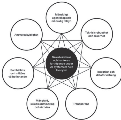
Figur 4.2: Sju krav för realiseringen av tillförlitlig AI, från AI HLEG 2019, bearbetad i svensk översättning i Larsson, S. (2020) "AI i EU: etiska riktlinjer som styrmedel".

Nivå iii, se Figur 4.2, tycks hittills ha fått mest betydelse för förståelsen av utmaningar i europeiska nationella AI-strategier, vilket är tydligt bland annat i den polska 74 och den norska. 75 Intressant nog är vissa av dessa krav redan tydligt reglerade i rättsordningen, däribland dataskydd och kravet på ickediskriminering. Andra krav, som det om transparens, tycks helt centralt för tillförlitlighetsfrågorna, men är i sin breda betydelse inte lika tydligt reglerat för implementeringen av AI-system i alla sektorer. För den offentliga förvaltningen är dock till exempel den öppenhet som dataskyddsrätten kräver samt rätten till partsinsyn helt relevanta reglerade aspekter av transparens. 76