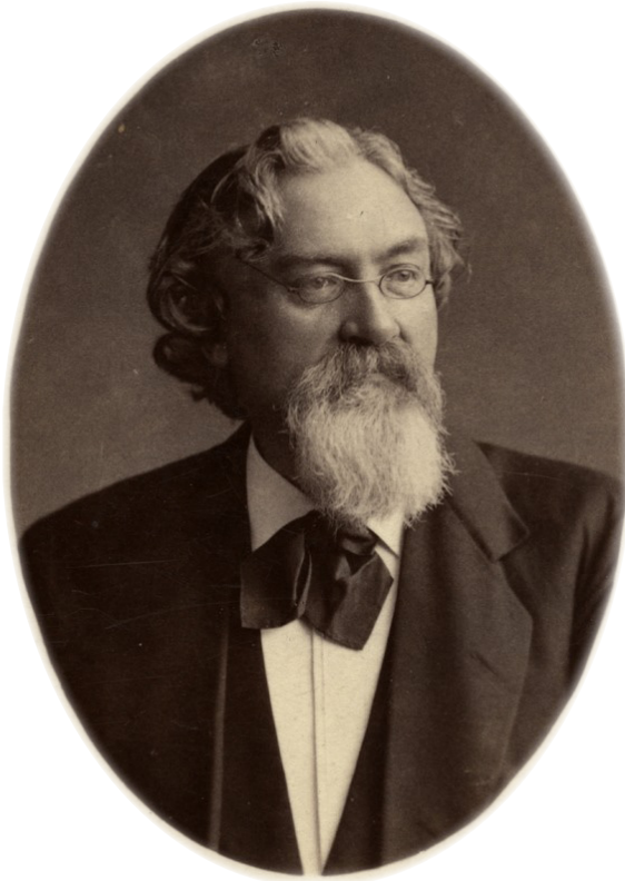
Öresunds-Postens stridbare redaktör Fredrik Theodor Borg (1824–1895).