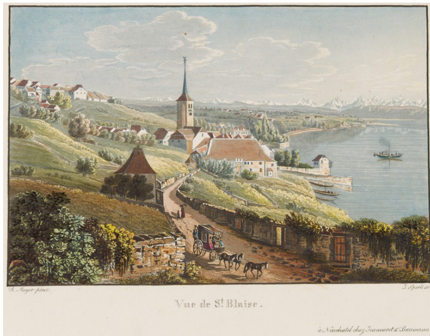
Motiv från Saint-Blaise på 1800-talet. Gravyr av Johann Jakob Sperli efter en förlaga av R. Meyer.