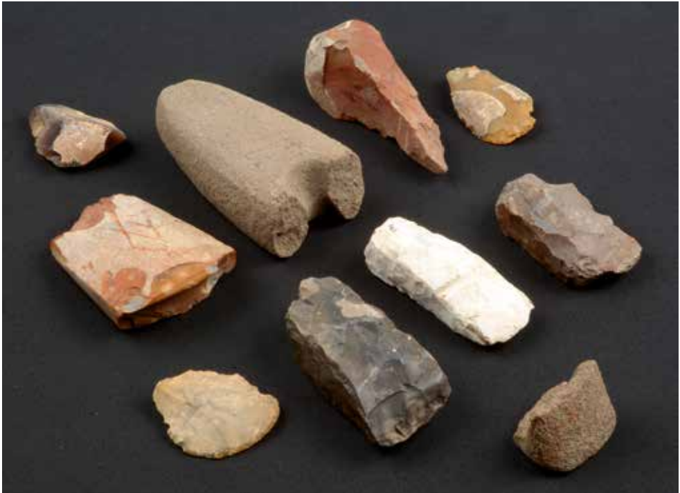
Figur 1. Neolitiska yxor, skrapor och en kil från samlingen.