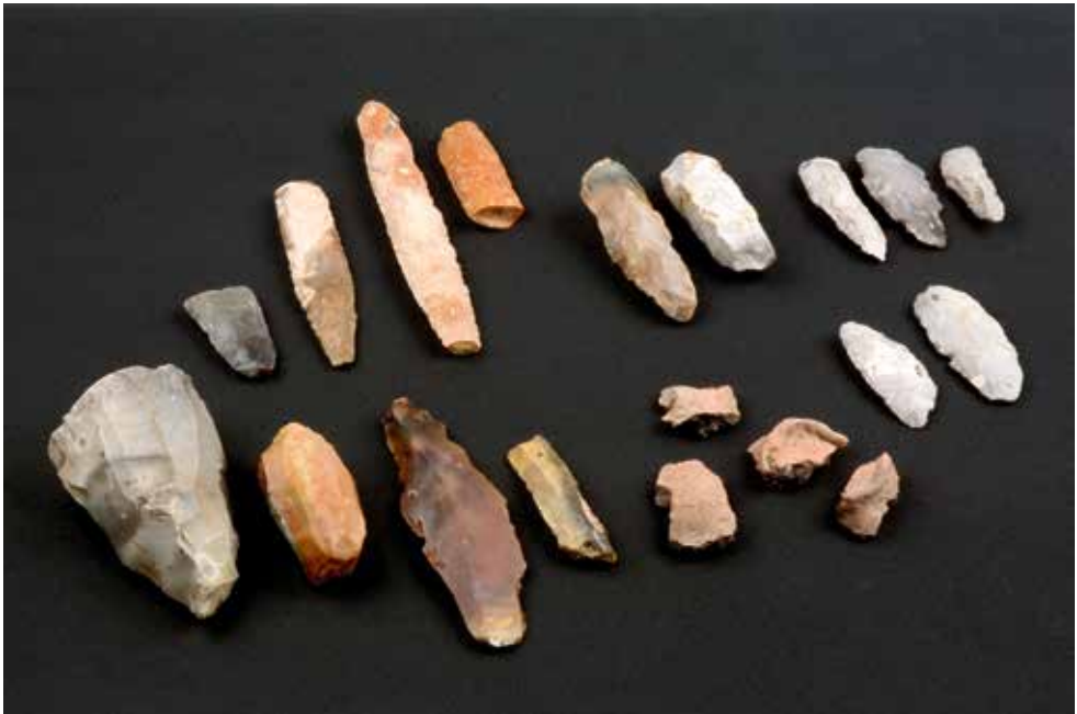
Figur 2. Neolitiska dolkar, mejslar, spån, kärnor, förarbeten, skärar och keramik från samlingen.