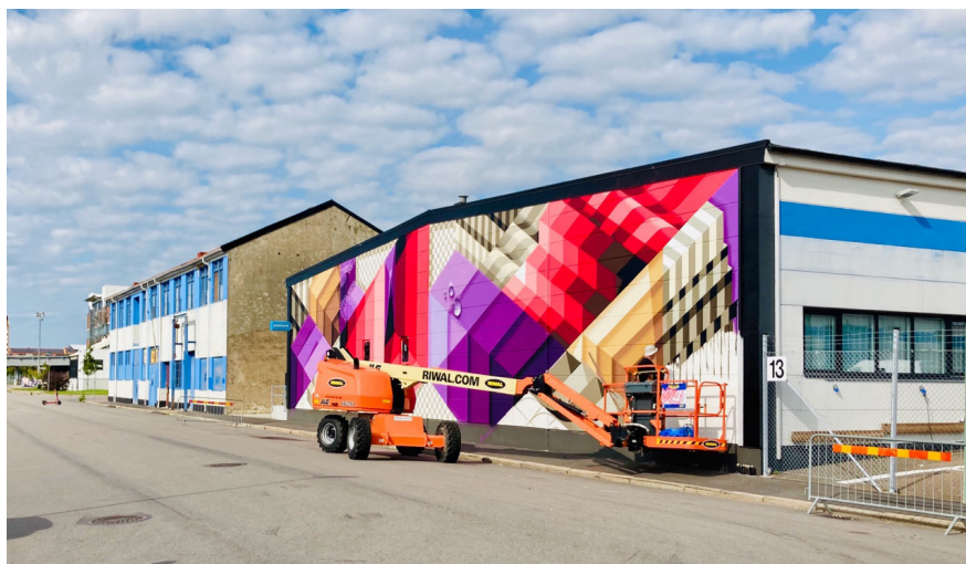
Bild 5. Pow Wow-festivalen, Gäseback.

Kulturhotellet är en konst- och kulturagentur som har ett nära samarbete med Helsingborg stad och en central aktör i utformningen av den offentliga konsten i Helsingborg. Det gäller särskilt gatukonst såsom muralmålning och sanktionerad graffitikonst. Kulturhotellet har avtalat att fastighetsägarna underhåller muralmålningarna i fem år. Därefter får de målas över. I intervjun med Kulturhotellet nämns att vissa platser fungerar bättre än andra och att konstnärerna måste rätta sig efter de direktiv som gäller. Väggarna som målas på måste gå att återställa, det går alltså inte att använda en tegelvägg (Personlig kommunikation, 2021). Därför används ibland rivningsklassade fastigheter och byggnader i industriområden för beställda verk eftersom det är lättare att få tillstånd att måla på dessa fasader. Kulturhotellet i samarbete med kulturförvaltningen och stadsbyggnadsförvaltningen arrangerar Kulturhotellet regelbundna gatukonstfestivaler i industriområdet Gäseback i Helsingborgs södra stadsdel. Syftet med ATT förlägga gatukonstfestivalerna i gamla industriområden och mindre attraktiva delar av staden är att skapa acceptans för konstformen och dess estetik, vilken därefter ska kunna spridas till andra delar av staden (Bild 5).