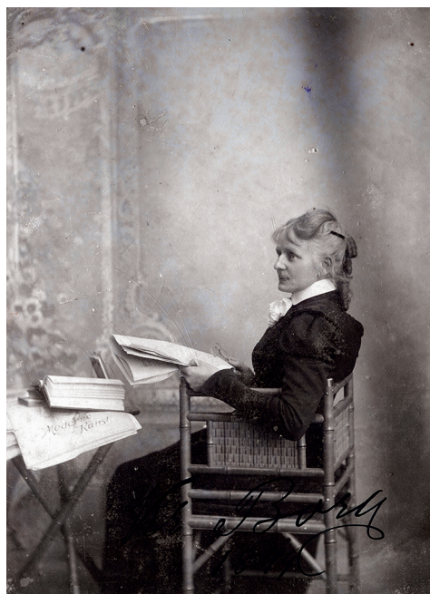
Figur 1. Porträtt av läsande Kristina Borg 1899.

Uppvuxen i ett gammaldags allmogeheim, i kretsen av många syskon, fick hon redan tidigt pröfva kvinnans särregna villkor. Läslysten som flickungen var, måste hon mången gång gömma boken under förklädet – så strängeligen var henne en pojksyssla sådan som bokläsning förbjuden. 1