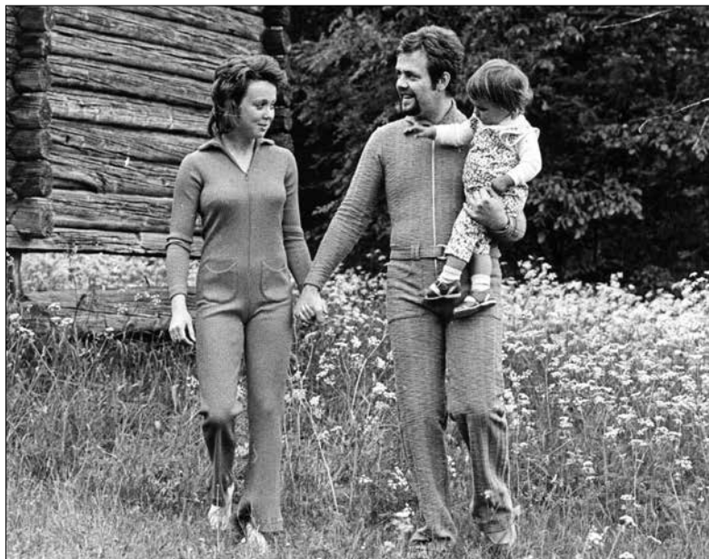
Tidstypisk mjukisfamilj?

ens anatomi anno 1973. Vem skulle få tolkningsföreträde när det gällde den kvinnliga sexualiteten?