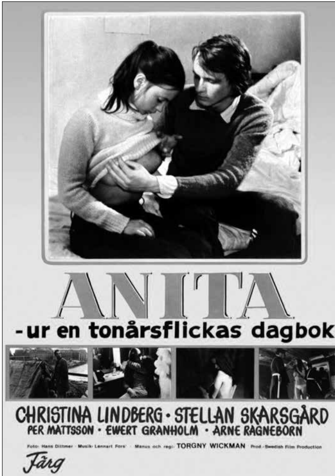
Filmaffisch för Anita – ur en tonårsflickas dagbok från 1973.