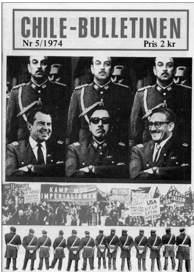
Kampen mot fascismen och USA-imperialismen pågick både i Chile och i Sverige. Framsida på Chile-bulletinen nr 5 1974.

ter i de små nationella härskarklickarna.” 30 Samarbete med andra anti-imperialistiska grupper, till exempel FNL-grupperna, Palestinagruppen i Stockholm, Stockholms Afrikagrupp och Svensk-kubanska föreningen, skedde också. Bland annat genomfördes en gemensam kampanjvecka mot imperialismen 1974. Den gemensamma parollen för denna vecka var: ”Chile, Angola, Palestina, Vietnam – samma fiende, samma kamp!” 31 Här återfinns en vrede över den orättvisa världsordningen som kanaliserades genom solidaritetsarbete.