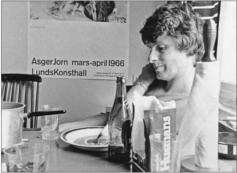
I köket i den lundsiska doktorandlyan, tidigt 1970-tal.