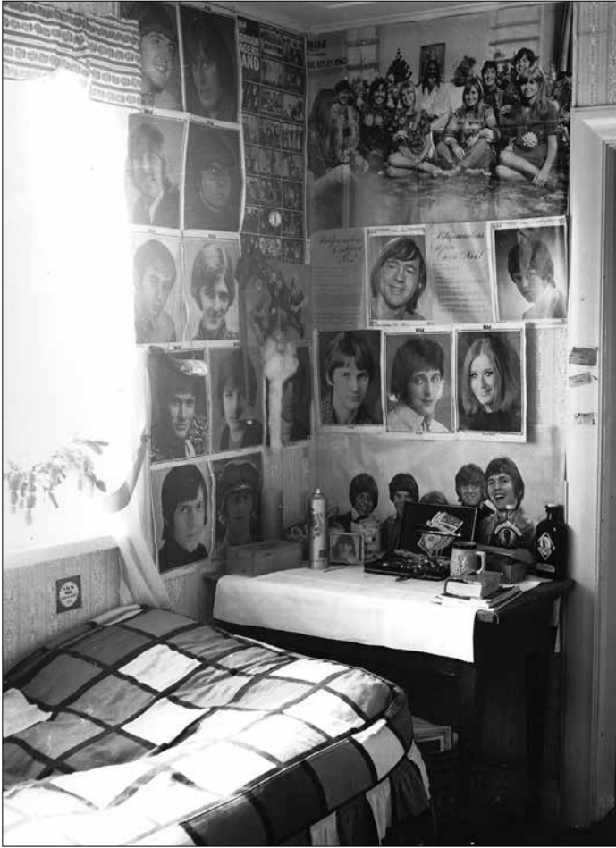
Det magiska året 1968 ses som 1970-talets startpunkt, men för de flesta tonåringar handlade livet om andra magiska ting än politik, som till exempel Bildjournalens samlarbilder i detta tonårsaltare från Sturups by.

se att mycket av frigörelsen från gamla mönster i själva verket skapade nya och växande konsumtionsfält. Producenterna på en expanderande marknad hade ett begränsat intresse av en konsumtion som var bunden till tid och plats. Flexibilitet, improvisation och informalisering skapade nya konsumtionsmönster, i experimenten med exotiska maträtter, nya färger, former och funktioner.