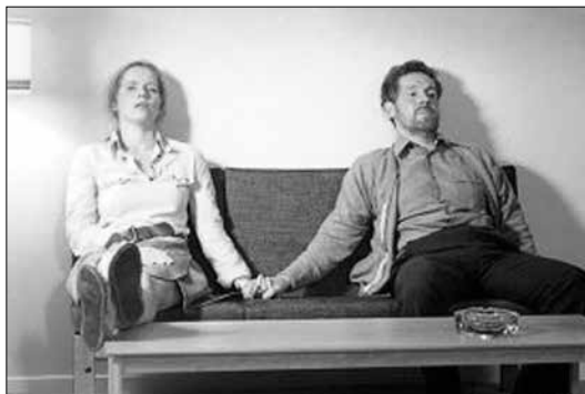
Marianne (Liv Ullman) och Johan (Erland Josephson) konfronterar sina äktenskapliga problem i Ingmar Bergmans Scener ur ett äktenskap 1973.