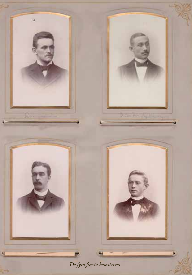
De fyra första hemiterna.

del därav. Donationsmedlen hade nämligen visat sig otillräckliga för att upplåta hemmets samtliga 20 rum kostnadsfritt enligt ursprunglig plan. Faktum är att det utöver Sommarin bara var ytterligare fem studenter som bodde hyresfritt. Övriga 14 rum uppläts till vanliga betalande boende (huruvida även kraven på ”oklanderligt uppförande” därvid bortföll framgår inte).