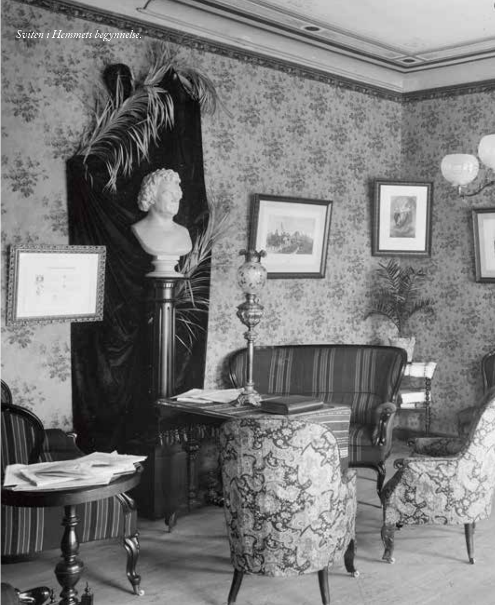
Sviten i Hemmets begynnelse.