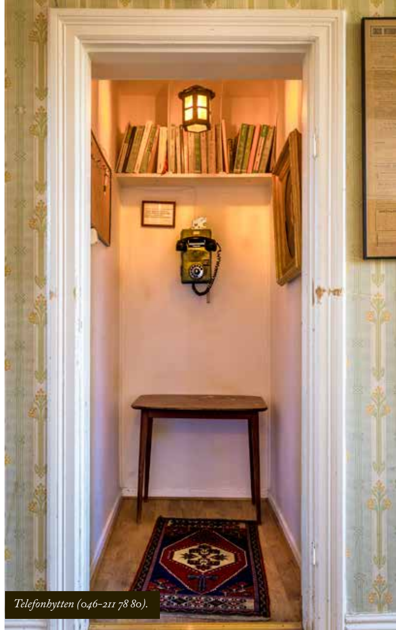
Telefonhytten (046-211 78 80).