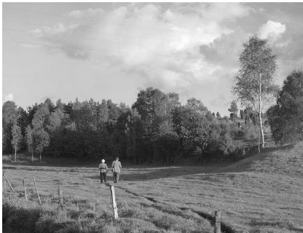
Figur 1. Märta Strömberg och Rolf Petré går en runda över gravfältet i samband med arbetet i Vätteryd.

material som ännu kvarstår som relativt outforskat med undantag för Strömberg och Petré presentation i ovan nämnda artikel. Arbetet med järnåldersgravfältet resulterade i en artikel i Norra Mellby sockenbok 1955 och Skånes Hembygdsförbunds årsbok 1959. 4 Materialet kom även att behandlas ingående i Strömbergs avhandling. 5