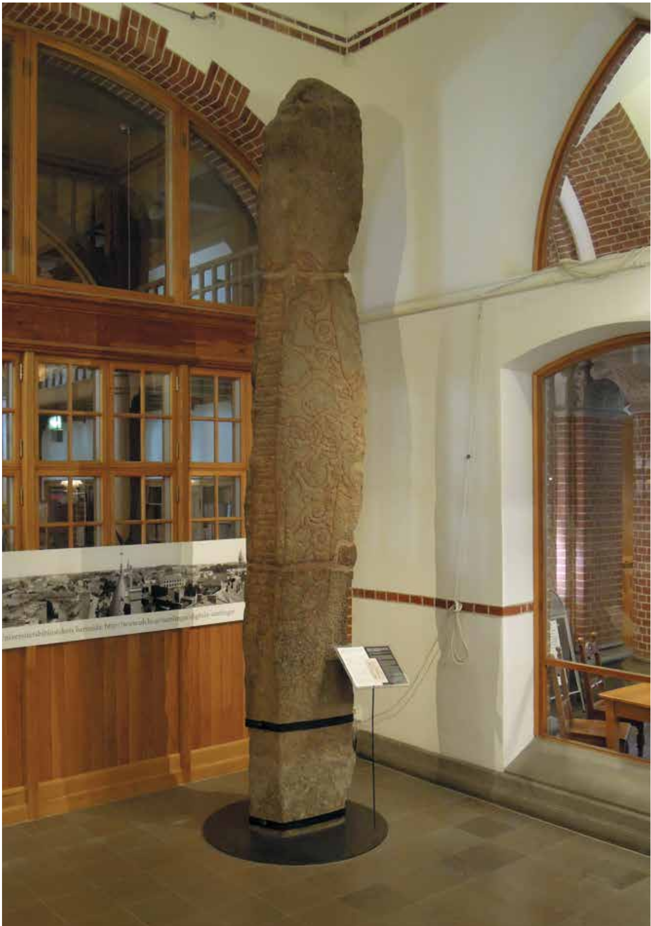
Figur 1. Lundagårdsstenen i Lunds universitetsbibliotek. Foto: Jes Wienberg, oktober 2014.