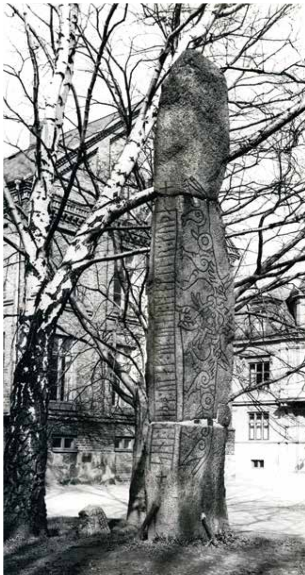
Figur 7. Lundagårdsstenen med sidorna B–C upptecknade. Foto: Erik Moltke, Nationalmuseet 1932.

När inte turister eller familjer till gäststudenter låter sig fotograferas vid runstenarna, fungerar högen i dag som övningsområde för arkeologisk digital dokumentation, som lunchställe, som lekplats vid ”nollning” av nya studenter och som del av Karnevalsområdet vart fjärde år. Ingen inskrift eller skyltning berättar om den ursprungliga tanken med minnesmärket, inget upplyser om den borttagna Lundagårdssten. Många tror, att det reducerade nationalromantiska minnesmärket är en gammal gravhög; illusionen har omsider blivit verklighet.